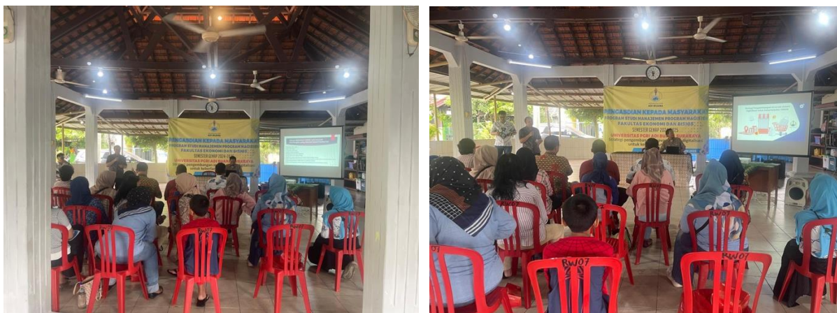
Gambar 2 Pelaksanaan Kegiatan Pengabdian kepada Masyarakat