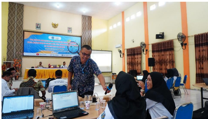
Gambar 1. Penyampaian Teknik Analisis Data oleh Narasumber

Kegiatan pengabdian kepada masyarakat ini dilaksanakan bersama MGMP Bahasa Inggris Kabupaten Sampang, yang menjadi wadah profesional bagi guru-guru Bahasa Inggris Sekolah Menengah Kejuruan (SMK) di wilayah tersebut. Kegiatan ini dilaksanakan sebagai tindak lanjut dari hasil identifikasi kebutuhan mitra yang menunjukkan bahwa guru-guru anggota MGMP membutuhkan peningkatan kompetensi dalam pengolahan dan analisis data akademik maupun non-akademik, serta penguatan kemampuan dalam pendampingan tutor sebaya untuk mendukung peningkatan kualitas pembelajaran.