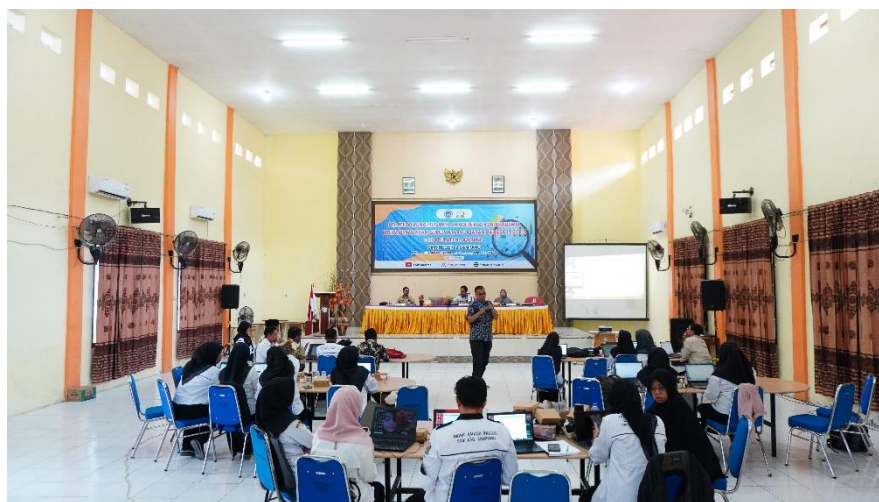
Gambar 2. Antusiasme Siswa dalam Kegiatan Sosialisasi

Hasil pelatihan yang telah dilaksanakan bersama MGMP Bahasa Inggris Kabupaten Sampang menunjukkan adanya peningkatan kemampuan guru dalam mengolah dan menganalisis data pendidikan menggunakan SPSS. Sebagian besar peserta yang sebelumnya belum terbiasa menggunakan perangkat analisis statistik kini mampu: (1) Memasukkan dan mengelola data pada lembar kerja SPSS; (2) Melakukan uji korelasi dan interpretasi hasilnya; (3) Melaksanakan uji beda rata-rata ( paired sample test ) untuk membandingkan hasil pretest dan posttest siswa; (4) Melakukan analisis regresi sederhana untuk melihat pengaruh antar variabel pembelajaran. Selain peningkatan kemampuan teknis, pelatihan ini juga memperkuat pemahaman peserta terhadap pentingnya pendekatan berbasis data ( evidence-based teaching ) dalam proses pembelajaran. Peserta pelatihan yang merupakan anggota MGMP Bahasa Inggris Kabupaten Sampang mulai memahami bahwa analisis data tidak hanya berguna untuk kepentingan administratif, tetapi juga dapat digunakan untuk mengevaluasi efektivitas metode mengajar, tingkat pemahaman siswa, dan kebutuhan peningkatan kualitas pembelajaran.