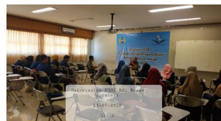
Gambar 7. Evaluasi bersama Pelaksanaan Pendampingan oleh Dinas Sosial Kota Surabaya

Evaluasi kegiatan pendampingan adik asuh menjadi sangat penting. Kegiatan tersebut dilakukan oleh Dinas Sosial kota Surabaya dan dosen pembimbing secara berkala. Segala permasalahan yang muncul di berikan solusi yang efektif agar pelaksanaan program pendampingan dapat berjalan dengan baik dan sesuai dengan perencanaan. Dinas sosial kota surabaya selalu memfasilitasi baik secara materiil maupun moril dengan memberikan rekomendasi-rekomendasi sampai dengan pemberian bantuan finansial. Hal tersebut memberikan motivasi tersendiri bagi kakak asuh untuk lebih aktif melakukan kegiatan pendampingan. Konsistensi pendampingan kakak asuh selalu ditekankan oleh Dinas Sosial kota