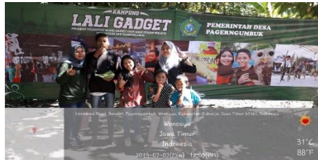
Gambar 5. Partisipasi dalam kegiatan “Kampung Lali Gadjet”

nyaman dalam bersosialisasi dengan teman sebayanya yang baru dikenal serta meningkatnya kemampuan komunikasi adik asuh dan tidak lagi malu.