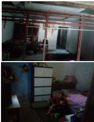
Gambar 1. Kondisi rumah adik asuh

Permasalahan yang muncul berdasarkan observasi lapangan antara lain: (1) Jumlah keluarga terdiri dari sembilan orang yaitu ayah, ibu, satu anak perempuan, dan enam anak laki-laki; (2) kondisi rumah sangat sederhana dan kurang proporsional karena ditempati oleh sembilan orang; (3) Kondisi lingkungan sekitar kurang mendukung karena terletak pada hunian kumuh dan kelompok menengah kebawah; (4) Rata-rata berstatus putus sekolah karena kondisi ekonomi keluarga yang kurang mampu; (5) Kondisi adik asuh yang putus sekolah sering mengamen untuk mendapatkan uang tambahan dan membantu pemenuhan kebutuhan sehari-hari; (6) kurangnya perhatian orang tua terhadap anaknya. Berdasarkan permasalahan – permasalahan yang didapatkan, peneliti fokus pada pengembalian adik asuh untuk kembali bersekolah dan mengembangkan minat bakatnya baik secara akademis maupun non akademis.