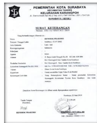
Gambar 2. Pengurusan SKTM di Kelurahan Tandes

Program Kegiatan Belajar Masyarakat (PKBM) merupakan lembaga bentukan masyarakat yang bergerak dalam bidang