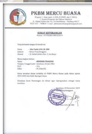
Gambar 4. Proses pendaftaran di PKBM MERCUBUANA Surabaya dan penyerahan bukti tidak adanya pungutan biaya

Program lain yang menunjang pengembangan karakter adik asuh, kakak asuh mengikutsertakan pada program “Kampung Lali Gadget” yang diadakan oleh pemerintah desa Pagerngumbuk kota Sidoarjo secara rutin setiap satu minggu sekali dengan tujuan pengembangan karakter serta menambah wawasan berkaitan pentingnya penggunaan gadget sesuai dengan kebutuhan. Selain itu, banyak perubahan yang terjadi pada adik asuh yaitu mulai