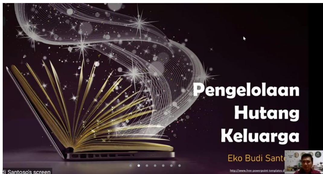
Gambar 2. Pemaparan Materi Mengenai Pengelolaan Hutang Keluarga

Pelaksanaan kegiatan diawali dengan pemaparan materi mengenai dasar pengelolaan keuangan keluarga dan pengelolaan hutang. Materi yang diberikan juga dibagikan kepada peserta untuk evaluasi lebih lanjut. Setelah pemaparan materi, para orang tua siswa SMA Citra Berkat dilibatkan dalam proses diskusi dan tanya jawab. Pelaksanaan kegiatan melalui metode daring dikarenakan pandemic covid 19. Pelaksanaan kegiatan juga akan melibatkan narasumber yang sesuai latar belakangnya. Pemaparan materi dan diskusi akan dilaksanakan guna membantu para peserta untuk lebih memahami tidak hanya konsep, namun hingga ke penerapannya.