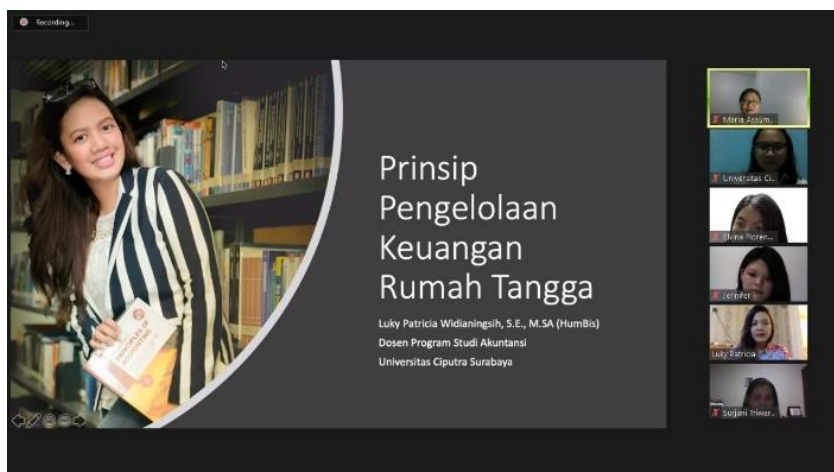
Gambar 1. Pelaksanaan pengabdian masyarakat melalui media daring