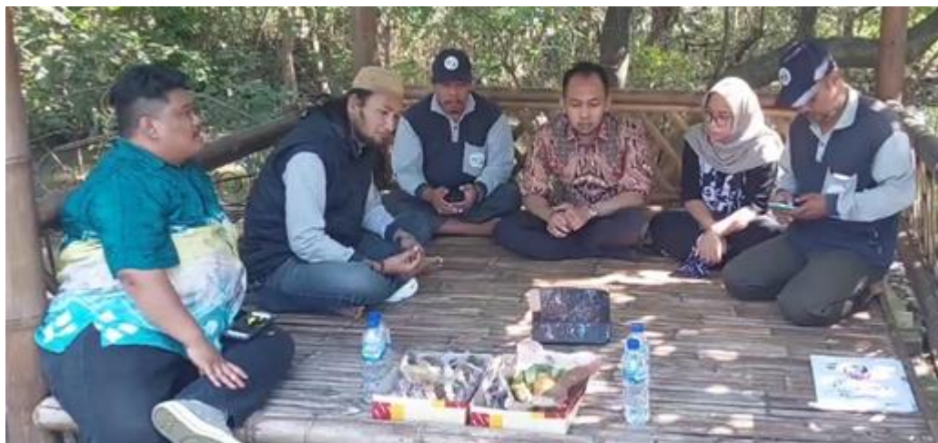
Gambar 4. Pendampingan Pembuatan Video Profile dan Media Promosi

Tim Pengabdian Kepada Masyarakat memberikan pendampingan pembuatan video profile dan editing video kepada Pengurus Kelompok Sadar Wisata (Pokdarwis) Ekowisata Mangrove Medokan Ayu. Pelaksanaan pendampingan tersebut terkait materi tentang bagaimana menentukan konten kreatif berbasis digital dan bagaimana cara editing video yang menarik. Selanjutnya dihari yang sama juga diberikan pendampingan terkait media promosi digital dan konvensional. Tahap pendampingan dilakukan dengan menggunakan metode simulasi. Metode ini merupakan eksperimen dengan tiga materi pelatihan yang diberikan (Yutanto et al., 2020). Pada sesi ini para Pengurus Kelompok Sadar Wisata (Pokdarwis) Ekowisata Mangrove Medokan Ayu diberikan materi terkait bagaimana cara membuat promosi wisata pada media digital maupun konvensional yang menarik.