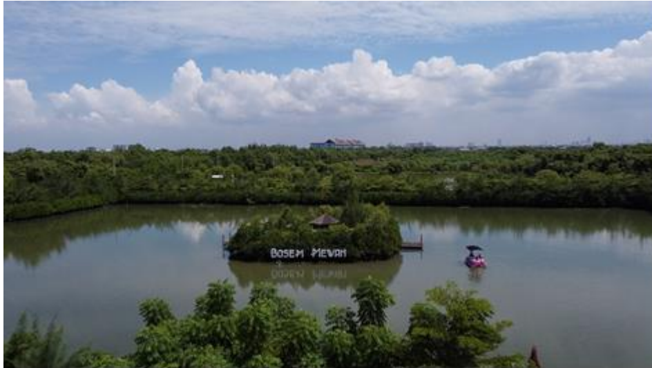
Gambar 1. Lokasi Ekowisata Mangrove Medokan Ayu

Sebelum adanya pandemi virus Covid-19, banyak wisatawan yang berkunjung ke kawasan Ekowisata Mangrove Medokan Ayu, karena memiliki spot foto yang menarik dan indah saat diunggah ke berbagai media sosial atau istilahnya saat ini “ instagramable ”. Kawasan Ekowisata Mangrove Medokan Ayu ini jika difoto akan menggambarkan keindahan alam dengan paduan langit biru dan pepohonan bakau yang menghijau. Banyaknya jumlah wisatawan yang datang berkunjung merupakan peluang bagi masyarakat sekitar ekowisata dan beberapa usaha kecil dan menengah. Namun, sejak pandemi, jumlah pengunjung menurun tajam sehingga berdampak pada penurunan pendapatan bagi usaha disekitar Ekowisata Mangrove Medokan Ayu sehingga berdampak pada ketidakmampuan membiayai pemeliharaan infrastruktur yang ada di lokasi Ekowisata Mangrove Medokan Ayu. Ketua Pokdarwis Medokan Ayu, Bapak Tasmir berinisiatif membenahi organisasi Pokdarwis dan mengorientasikannya pada pemanfaatan teknologi. Perbaikan dilakukan saat Kebun Raya Mangrove Medokan Ayu ditutup sementara. Pasca penutupan sementara, Ketua Pokdarwis Medokan Ayu juga ingin lebih memperkenalkan Kebun Raya Mangrove Medokan Ayu karena Ekowisata Mangrove Wonorejo selama ini lebih terkenal (Yutanto et al., n.d., 2023).