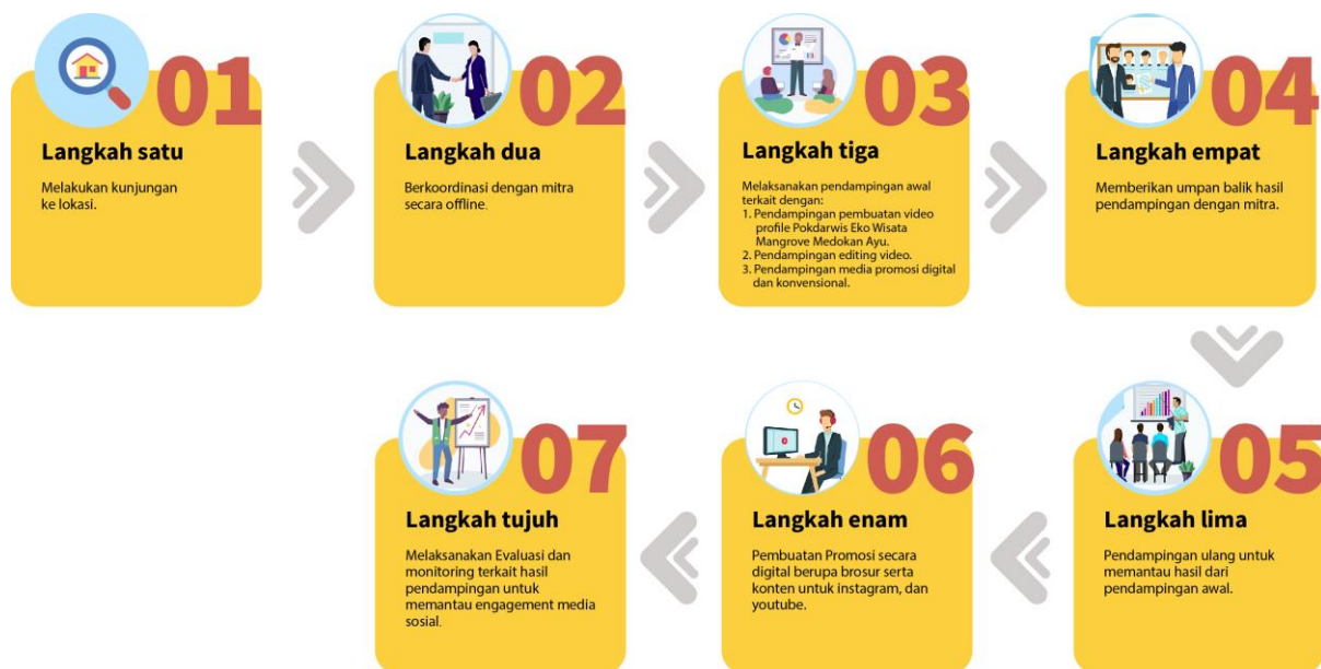
Gambar 3. Kerangka Pelaksanaan Kegiatan

Pelaksanaan Pengabdian Kepada Masyarakat di Ekowisata Mangrove Medokan Ayu memiliki beberapa kegiatan dengan indikator capaian adalah sebagai berikut :