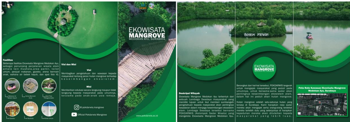
Gambar 6. Media Promosi Ekowisata Mangrove Medokan Ayu melalui Brosur

sedang mengunjungi perusahaan atau lembaga, kita dengan mudah menerimanya. Brosur biasanya berisi informasi atau penjelasan yang jelas namun ringkas dan menarik tentang produk, jasa atau profil untuk menciptakan citra baik perusahaan atau lembaga. Meski terkesan tradisional, nyatanya penggunaan brosur sebagai alat periklanan dan presentasi juga sangat efektif untuk menarik perhatian masyarakat luas (Lengkey, Debora M; Y. Rindengan, Yaulie D; Tulenan, 2014). Tujuan dari penggunaan brosur adalah mempermudah Pengurus Kelompok Sadar Wisata (Pokdarwis) Ekowisata Mangrove Medokan Ayu untuk mempromosikan potensi Ekowisata Mangrove Medokan Ayu.