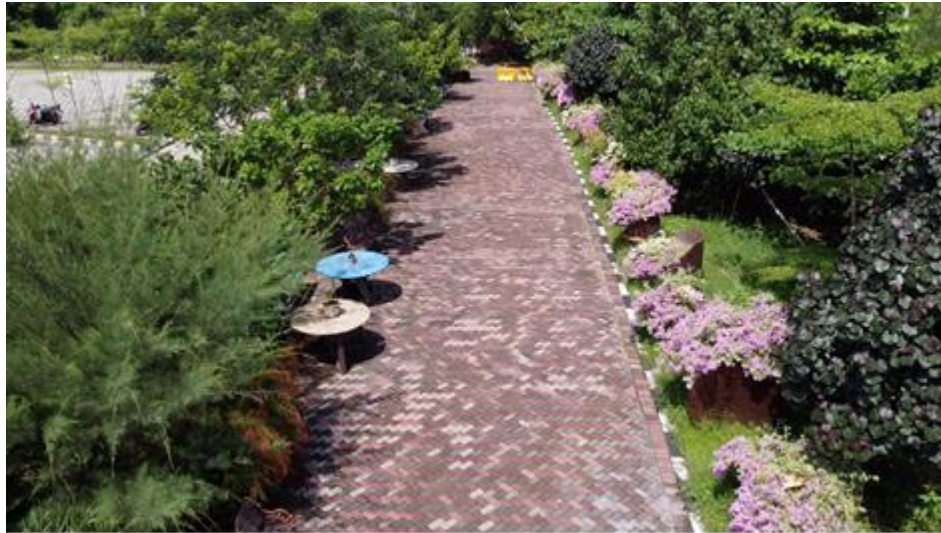
Gambar 2. Kondisi Sepi Ekowisata Mangrove Medokan Ayu

modern. Kehadiran pemasaran digital juga meningkatkan minat terhadap perjalanan. Kegiatan pemasaran digital biasanya dilakukan melalui web, medsos, promosi digital, email penjualan langsung, ruang obrolan, dan aplikasi yang ada di handphone (Warmayana, 2018).