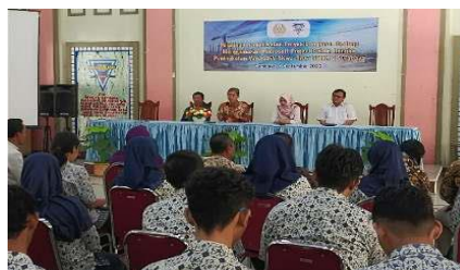
Gambar 1. Sambutan Pembukaan oleh Koorprodi