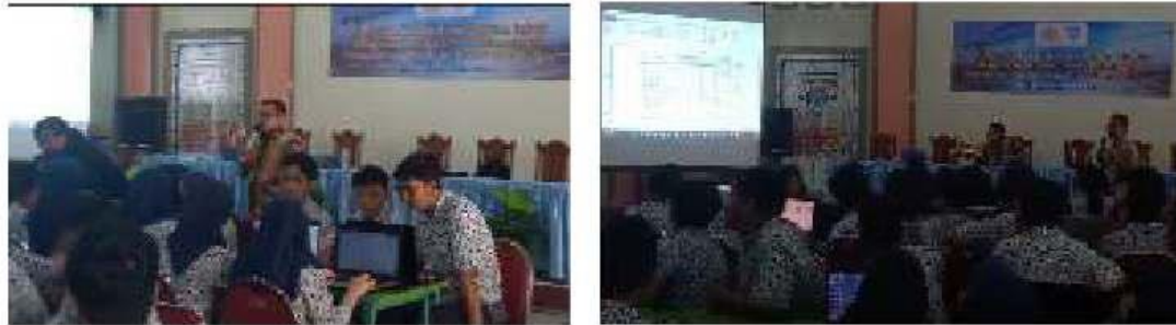
Gambar 2. Antusiasme Peserta Pelatihan di Sesi Pelatihan Terbimbing

Teknik Sipil di SMKN 2 Surabaya, yaitu pelatihan dengan topik SAP2000 dan Topik Microsoft Project (Gambar 1).