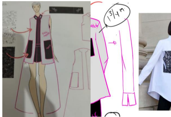
Gambar 6. Proses Komunikasi Desain

Proses pada gambar 6 merupakan proses komunikasi dengan bagian produksi yaitu pembuatan pola dan jahit dari hasil desain yang sudah terpilih dalam proses kurasi. Peserta juga diberi wawasan untuk membuat gambar teknis secara lengkap dan detail. Untuk memudahkan peserta tidak menggambar dari awal, diberikan template standar figur gambar teknis. Berikutnya dilakukan proses membuat prototype yang dilakukan tim narasumber dan juga peserta workshop (gambar 7).