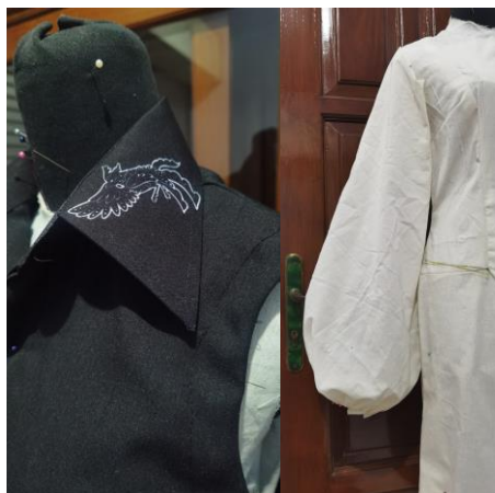
Gambar 7. Proses Pembuatan Prototype

Proses pada gambar 6 merupakan proses komunikasi dengan bagian produksi yaitu pembuatan pola dan jahit dari hasil desain yang sudah terpilih dalam proses kurasi. Peserta juga diberi wawasan untuk membuat gambar teknis secara lengkap dan detail. Untuk memudahkan peserta tidak menggambar dari awal, diberikan template standar figur gambar teknis. Berikutnya dilakukan proses membuat prototype yang dilakukan tim narasumber dan juga peserta workshop (gambar 7).