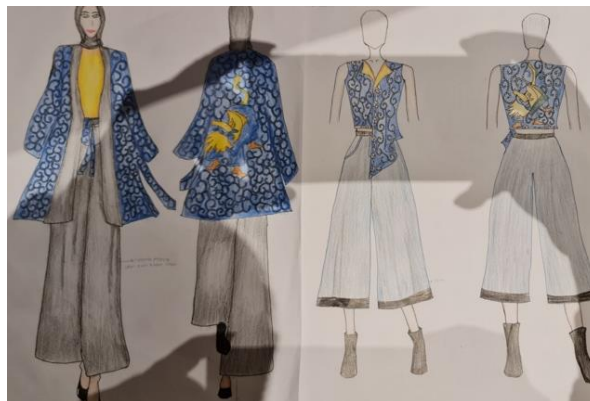
Gambar 4. Ilustrasi Awal Peserta

Pelaksanaan workshop pengembangan desain busana bersama mitra Indonesia Fashion Chamber Surabaya melihat karena memang pentingnya desain sebagai elemen kunci dalam membangun daya tarik produk dan menarik minat konsumen. Sebelum workshop dilakukan, peserta diminta untuk membuat sketsa / ilustrasi fashion yang nantinya akan dikembangkan selama pendampingan dan kegiatan workshop .