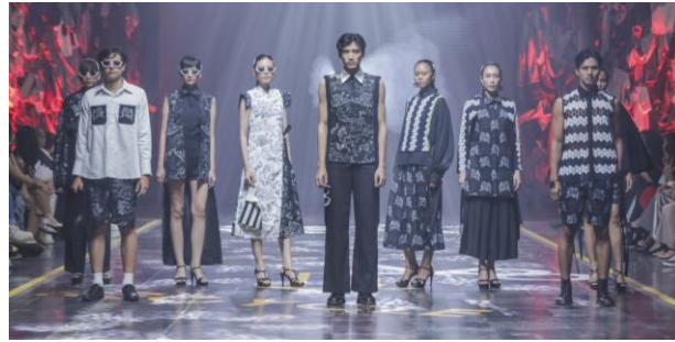
Gambar 8. Presentasi Hasil di Spotlight 2023

Dari proses dan hasil yang telah dipresentasikan tersebut, pelaksanaan kegiatan pengembangan desain busana bagi UKM industri fashion di Surabaya mendapat respon positif dari pasar, hal ini ditunjukkan dari liputan media-media dan penjualan.