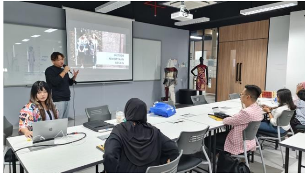
Gambar 3. Kegiatan Menjelaskan Materi