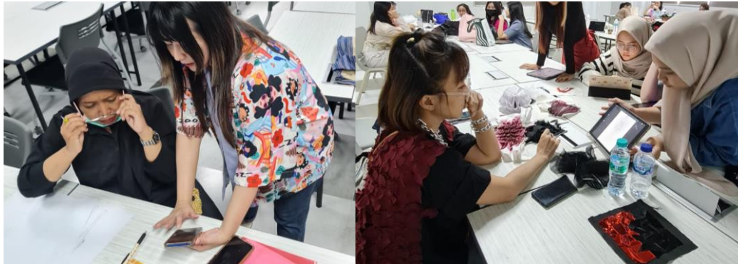
Gambar 5. Proses Mentoring Desain

komposisi peletakan elemen-elemen desain tersebut. Metode perancangan desain fashion menjadi dasar cara peserta mengembangkan desain dari ilustrasi awal yang telah dibuat (Indarti, 2020), ada 2 cara yaitu dengan mengembangkan desain inisial dan dengan metode mix & match produk busana yang didesain. Dan penjelasan materi mengenai tren fashion berdasarkan Fashion Trend Forecasting 2024/2025 menjadi panduan peserta untuk mengembangkan desain merujuk pada tema budaya lokal ( localism ) di Indonesia, yang juga merupakan salah satu aspek dari fashion berkelanjutan (Handayani et al., 2020).