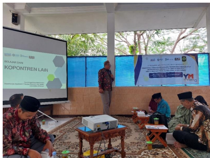
Gambar 2. Penyampaian Materi Penguatan Kelembagaan

Dengan pemahaman yang lebih baik tentang masalah-masalah krusial yang dihadapi Koperasi Pesantren Dwima Kulon Progo, tim pengabdian merumuskan pelatihan materi yang relevan yang diharapkan dapat meningkatkan kapabilitas dan keberlanjutan Koperasi Pesantren Dwima Kulon Progo. Materi pertama berfokus pada penguatan tata kelola koperasi. Tujuannya adalah meningkatkan efektivitas manajemen dan memperjelas struktur organisasi, sehingga setiap anggota memahami peran dan tanggung jawabnya. Selain itu, pelatihan ini juga menyoroti pentingnya penerapan prinsip-prinsip tata kelola yang transparan dan akuntabel untuk meningkatkan kepercayaan anggota dan Masyarakat sekitar. Dalam sesi ini, pengurus koperasi juga mendapatkan inspirasi dari studi kasus kesuksesan koperasi pesantren lain di Indonesia yang telah berhasil mencapai keberlanjutan. Studi kasus ini memberikan wawasan mengenai praktik-praktik unggulan yang dapat diadopsi dan disesuaikan dengan konteks Koperasi Pesantren Dwima Kulon Progo.