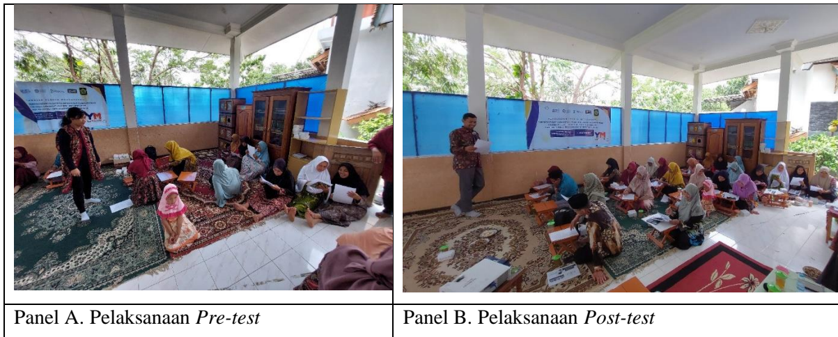
Panel A. Pelaksanaan Pre-test