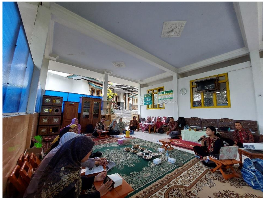
Gambar 3. Penyampaian Materi Branding dan Pemasaran Digital

Materi ketiga berfokus pada pengenalan crowdfunding sebagai alternatif sumber pendanaan untuk meningkatkan modal koperasi. Crowdfunding, atau penggalangan dana dari masyarakat melalui platform digital, diperkenalkan sebagai solusi inovatif untuk mengatasi keterbatasan modal yang dihadapi koperasi. Peserta pelatihan diajarkan cara merancang kampanye crowdfunding yang menarik, memilih platform yang tepat, dan membangun jaringan pendukung. Selain itu, pelatihan ini juga menekankan pentingnya transparansi dan akuntabilitas dalam pengelolaan dana agar koperasi dapat membangun kepercayaan publik dan menarik lebih banyak partisipasi dari donatur atau investor.