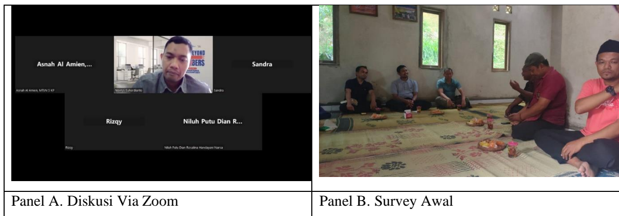
Panel A. Diskusi Via Zoom