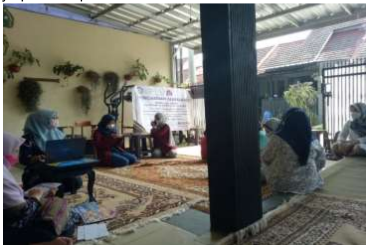
Gambar 1. Kegiatan Penyuluhan tentang Penyakit Diabetes Mellitus

Penyuluhan Diabetes Mellitus serta Pelayanan Kesehatan Penyuluhan dilakukan untuk menyampaikan informasi secara umum tentang penyakit Diabetes Militus. Penjelasan yang disampaikan meliputi definisi Diabetes Militus, kriteria seseorang dapat dikatakan Diabetes Militus. Diperkenalkan juga berbagai type alat yang digunakan untuk mengukur kadar gula darah. Beberapa penyebab Diabetes Militus yang meliputi gangguan hormonal (insulin), diet, obesitas dan kehamilan dalam menimbulkan Diabetes Militus. Pada pengabdian masyarakat ini disampaikan pula cara-cara untuk mengontrol kadar gula darah. Disarankan agar kadar gula darah diperiksa secara teratur, menjaga proporsionalitas berat badan, menjaga pola makan / life stile, hindari rokok, minum obat seperti yang sudah diresepkan, sering berkonsultasi dengan dokter dan apoteker, rutin berolahraga, serta hidup secara normal dan bahagia. Selain diberi edukasi secara oral, juga dibuatkan brosur agar pasien dapat memahami pentingnya pola hidup sehat.