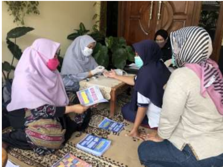
Gambar 2. Pengecekan Gula Darah dan Edukasi Kesehatan

Kegiatan yang dilakukan berupa melakukan pemeriksaan kadar gula darah kepada pasien. Pemeriksaan kadar gula darah dilakukan dengan alat glucometer. Hasil pemeriksaan dicatat dalam kartu pasien untuk selanjutnya dilakukan edukasi sesuai dengan hasil pemeriksaan dan riwayat sebelumnya. Peserta yang datang mengisi lembar kehadiran yang terdiri dari nama, alamat dan umur. Sebanyak 25 peserta penyuluhan dengan rentang umur 21 – 64 tahun dicek kadar gula darahnya dan didapatkan nilai kadar gula darah (KGD) berkisar dari 73 – 148 mg/L. Parameter pemeriksaan kadar gula darah terbagi menjadi 2 yaitu Gula Darah Sewaktu (GDS) / Tanpa Puasa dengan nilai KGD tidak lebih dari 200 mg/dL, dan Gula Darah Puasa tidak lebih dari 126 mg/dL. Peserta penyuluhan umumnya sudah sarapan pada saat sebelum pemeriksaan, sehingga KGD semua peserta termasuk normal karena tidak lebih dari 200 mg/dL.