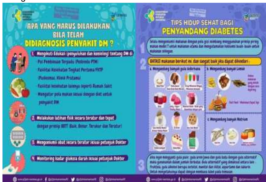
Gambar 6. Brosur Edukasi Kesehatan (Gernas Kemenkes RI)

Kader posyandu sebagai mitra pelaksanaan pengabdian dan juga warga setempat mengharapkan kegiatan edukasi, penyuluhan dan pemeriksaan kesehatan di Komplek villa pajajaran permai, Kec. Cileunyi, Kab. Bandung, Jawa Barat dapat berlanjut dan dilakukan secara kontinyu untuk meningkatkan kesadaran masyarakat untuk menjaga pola hidup sehat. Serta, diadakan juga kerjasama dengan instansi kesehatan untuk edukasi kesehatan dengan tema yang lebih berbeda dan dapat dilakukan dalam skala besar. Brosur edukasi Kesehatan ditunjukkan pada gambar 5.