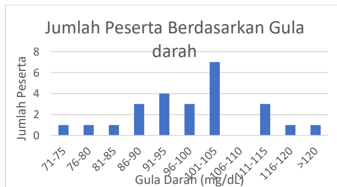
Gambar 5. Grafik hasil pemeriksaan gula darah