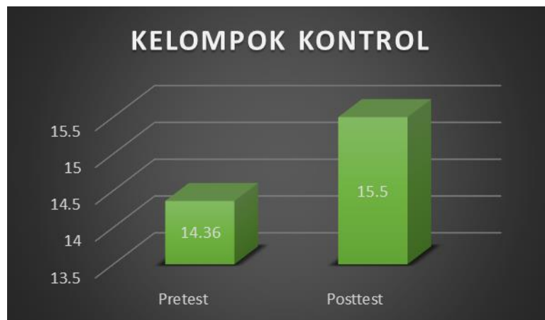
Gambar 2. Diagram Batang Nilai Rata-Rata Pretest dan Posttest Kelompok Kontrol

pengaruh yang signifikan hasil pretest dan posttest siswa kelas IV SDN Sukadami pada kelompok eksperimen yang diberi perlakuan permainan tradisional galasin. Adanya peningkatan nilai rata-rata kebugaran jasmani tersebut merupakan hasil dari tes kebugaran jasmani yang dilakukan oleh siswa, karena dengan menggunakan permainan tradisional dapat meningkatkan kecepatan, kelincahan tubuh siswa, konsentrasi siswa, dan kerjasama siswa, sehingga kegiatan belajar mengajar lebih bervariasi, sehingga dapat menarik minat dan motivasi belajar siswa untuk mengikuti proses pembelajaran penjaskes. Sejalan dengan penelitian yang dilakukan oleh Afif Mashuri (2018) yang menyatakan bahwa terdapat peningkatan kebugaran jasmani melalui permainan tradisional gobak sodor siswa kelas V SDN Pulo Lor 4 Jombang, Kec. Jombang. Kab . Jombang. Dari hasil penelitian pada kelompok kontrol yang tidak diberi perlakuan permainan tradisional galasin menunjukkan adanya peningkatan nilai pretest dan posttest , hal tersebut dapat dilihat pada gambar berikut: