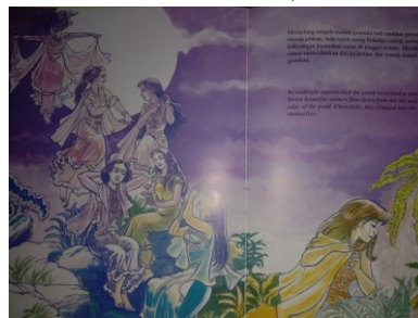
Gambar 1.6 Bidadari di Kolam Ikan

Plot dalam cerita Topitu memiliki tahapan awal alur pada cerita tersebut adalah sebagai berikut: (1) Penjelasan awal tentang tokoh Pemuda (eksposisi) (2) Peristiwa ketika tokoh Pemuda di kolam ikan (instabilitas).