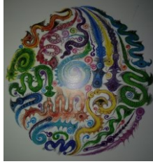
Gambar 1. 2 Nyale