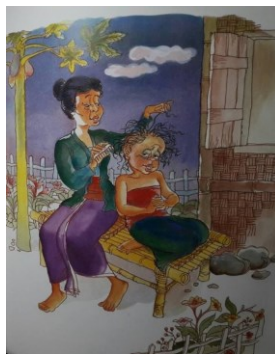
Gambar 1. 4 Suwidak Loro

Plot dalam cerita Suwidak Loro memiliki tahapan awal alur pada cerita tersebut adalah sebagai berikut: (1) Penjelasan awal tentang Penjelasan awal mula nama anak tokoh Janda (eksposisi) (2) Peristiwa ketika tokoh Ibu bersenandung dan berdoa. (instabilitas).