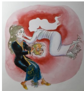
Gambar 1. 5 Peristiwa Pertukaran Wajah Suwidak Loro

Pada bagian (3) dan (4) merupakan bagian konflik. Bunanta memberikan sebuah konflik yang dimulai dengan peristiwa ketika tetangga mulai resah dan marah dengan suara tokoh ibu Suwidak Loro yang setiap malam bersenandung mengadukannya kepada Raja. Mendengar hal tersebut, tokoh raja menjadi tertarik untuk melamar Suwidak Loro dan memerintahkan patihnya untuk datang melamar. Tokoh Ibu Suwidak Loro yang menerima hal tersebut mengajukan usul untuk membawa pakaian pengantin ke rumah dan disetujui oleh patih. Kemudian tokoh ibu Suwidak Loro kembali ke rumah memberitahu anaknya dan mulai merias anaknya. Akan tetapi, hal tersebut membuat Suwidak Loro berpenampilan semakin buruk. Tokoh Suwidak Loro pun diperintahkan untuk masuk ke dalam tandu dan dibekali makanan untuk bekal di jalan. Ketika diperjalanan menuju istana ini merupakan sebuah bagian klimaks. Di tengah perjalanan Suwidak Loro didatangi oleh tokoh seorang Dewi yang meminta makanan Suwidak Loro karena anaknya menginginkannya, tetapi ia tidak ingin membaginya. Tokoh Anak Dewi itupun terus menangis dan Dewi kembali menemui Suwidak Loro. Tokoh Suwidak Loro pun memberikan sebuah kesepakatan untuk menukarkan wajahnya dengan anak Dewi dan disetujui.