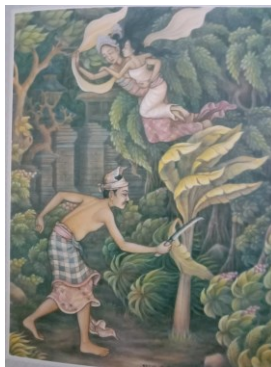
Gambar 1. 3 Pisang Pengganti Ni Terong Kuning Sumber: Buku Cerita Rakyat Ni Terong Kuning

Pada bagian ini merupakan peristiwa ketika tokoh I Puduk mengajak anaknya untuk pergi dengan tujuan untuk membunuhnya. Mereka berjalan melintasi ladang, bukit dan menyebrangi sungai hingga menemukan sebuah Pura. Tokoh I Puduk langsung melancarkan aksinya untuk memenggal kepala Ni Terong Kuning, tetapi tokoh Ni Terong Kuning digantikan menjadi sebuah pohon pisang oleh Bidadari yang mengetahui niat buruk I Puduk. Tokoh I Puduk tetap melihat pohon pisang tersebut sebagai Ni Terong Kuning.