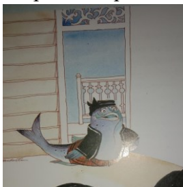
Gambar 1. 1 Ikan Jerawan

Awal kisah ini, Bunanta memberikan sebuah pengenalan terhadap para tokoh yaitu tujuh gadis cantik yang belum kunjung menikah. Hal ini merupakan bagian dari eksposisi . Pada bagian ini, Bunanta menjelaskan bahwa banyak sekali pemuda yang datang untuk melamar ketujuh gadis cantik ini, tetapi tidak satu pun pemuda yang diterimanya. Hingga akhirnya tidak ada lagi pemuda yang berani untuk melamar mereka. Kemudian Bunanta memosisikan sosok jerawan sebagai tamu yang akan melamar salah satu dari tujuh gadis tersebut. Pada bagian tersebut sudah memasuki bagian instabilitas yang berisi perubahan alur menuju cerita yang lebih dalam. Hal ini terbukti pada kutipan: