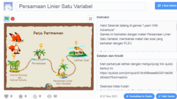
Gambar 3. Tampilan peta game

Tampilan peta pada Gambar 3 menggambarkan perjalanan yang sesuai dengan alur belajar pada topik PLSV. Peta perjalanan yang akan dilalui oleh pemain untuk menyelesaikan game ini, terdiri dari empat buah destinasi. Selain itu, terdapat animasi hewan rubah yang diberi nama "Cio". Rubah tersebut akan memandu game dan menjelaskan aturan dari setiap destinasi. Materi yang termuat dalam setiap destinasi ini meliputi kalimat terbuka dan tertutup, persamaan, persamaan linear satu variabel, dan beberapa latihan soal. Untuk masuk ke setiap destinasi yaitu dengan mengklik tombol yang berwarna kuning pada setiap destinasi.