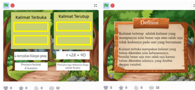
Gambar 4. Tampilan mencocokkan kalimat dan definisi

Tampilan peta pada Gambar 3 menggambarkan perjalanan yang sesuai dengan alur belajar pada topik PLSV. Peta perjalanan yang akan dilalui oleh pemain untuk menyelesaikan game ini, terdiri dari empat buah destinasi. Selain itu, terdapat animasi hewan rubah yang diberi nama "Cio". Rubah tersebut akan memandu game dan menjelaskan aturan dari setiap destinasi. Materi yang termuat dalam setiap destinasi ini meliputi kalimat terbuka dan tertutup, persamaan, persamaan linear satu variabel, dan beberapa latihan soal. Untuk masuk ke setiap destinasi yaitu dengan mengklik tombol yang berwarna kuning pada setiap destinasi.