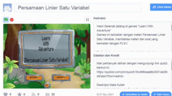
Gambar 2. Tampilan awal program

Keempat Assembly , proses pembuatan game menggunakan aplikasi Scratch sesuai dengan tahapan yang telah dibuat. Kelima Testing , tahap pengujian ini dilakukan secara berulang-ulang setelah proses pembuatan selesai. Pada tahap ini dilakukan dengan pengecekan 4 setiap bagian program game untuk mengetahui benar tidaknya program. Tahap ini disebut sebagai uji alpha (alpha test) yang dilakukan oleh tim pembuat program yang di dalamnya terdapat dosen ahli multimedia. Keenam Distribution , program disimpan pada Google Drive dan web Scratch dengan cara register/login pada web tersebut. Adapun hasil dari pengembangan game Learn With Adventure pada topik PLSV melalui Scratch adalah sebagai berikut: