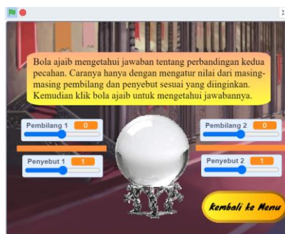
Gambar 3. Tampilan Bola Ajaib sebelum revisi