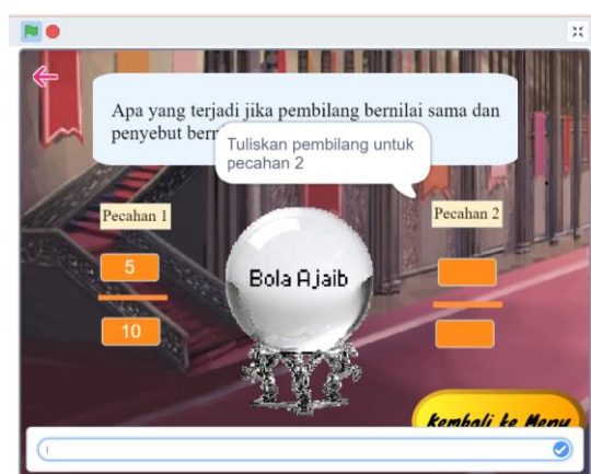
Gambar 4. Tampilan Bola Ajaib setelah revisi