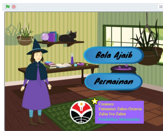
Gambar 1. Tampilan Awal Media Pembelajaran

Produk yang dihasilkan pada penelitian ini berbentuk game online yang dapat dimainkan oleh siswa, baik secara mandiri maupun dengan bimbingan guru. Dalam mendesain produk, yang dilakukan, yaitu membuat terlebih dahulu desain, kemudian baru mengaplikasikannya pada bahasa pemrograman Scratch.