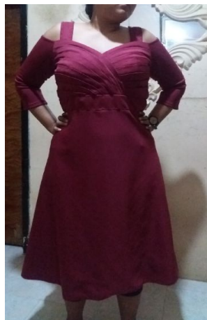
Gambar 1. Gaun dengan Pola Meyneke

Berdasarkan hasil eksperimen gaun dengan pola Meyneke dengan ukuran XL dapat dilihat pada gambar