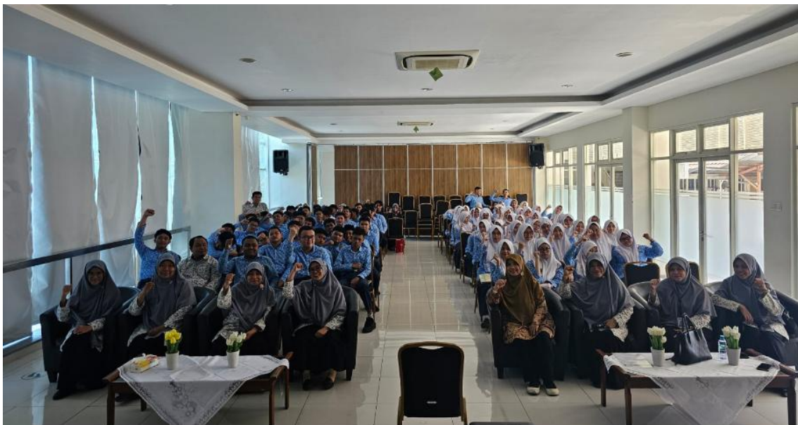
Gambar 1. Dokumentasi Kegiatan PkM

Dokumentasi pelaksanaan PkM diperlihatkan pada Gambar 1.