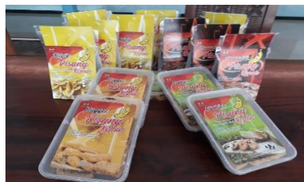
Gambar.2 Contoh Produk Varian Olahan Pisang Kepok Produk Desa Grinting

Program kerja UMKM yang berhasil dilaksanakan melalui pemanfaatan buah pisang kepek untuk dijadikan makanan olahan atau produk olahan yang bernilai jual tinggi., juga membuat masyarakat memiliki pengetahuan dan keterampilan yang lebih kreatif dan inovatif sehingga produk yang dihasilkan terlihat unik dan mampu menarik minat pembeli. Kreasi dan inovasi yang unik dari produk olahan pisang ini juga dikemas dari sisi penampilan dengan memperhatikan disain yang menarik sehingga tercipta brand yang dapat melekat di hati pembeli. Nama produk dan kemasan yang dibuat unik, kreatif dan inovatif tersebut diharapkan dapat menginterpretasikan bahwa produk tersebut merupakan produk original dan khas desa Grinting. Diharapkan produk ini mampu menjadi produk yang tidak hanya dikenal di desa Grinting, melainkan di seluruh Sidoarjo bahkan diluar kabupaten Sidoarjo. Hasil produk olahan pisang kepek dapat di lihat pada gambar berikut: