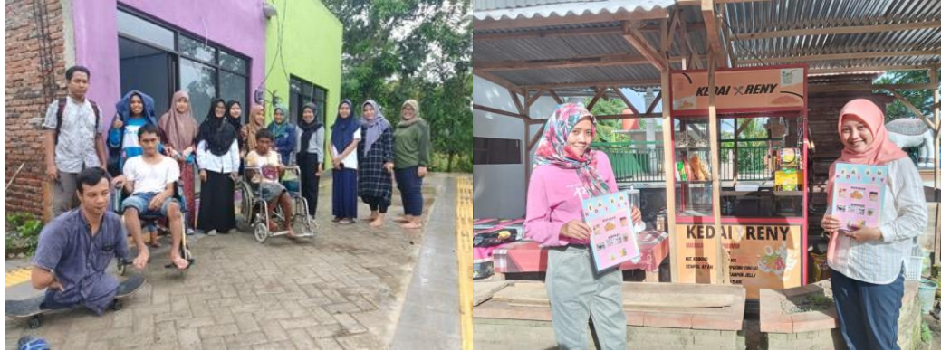
Gambar 5. Kegiatan Monitoring dan Evaluasi On Site