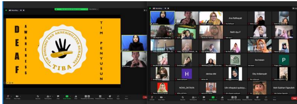
Gambar 3. Salah satu agenda tahap persiapan yakni pelatihan Bisindo bagi Mahasiswa pendamping Disabilitas