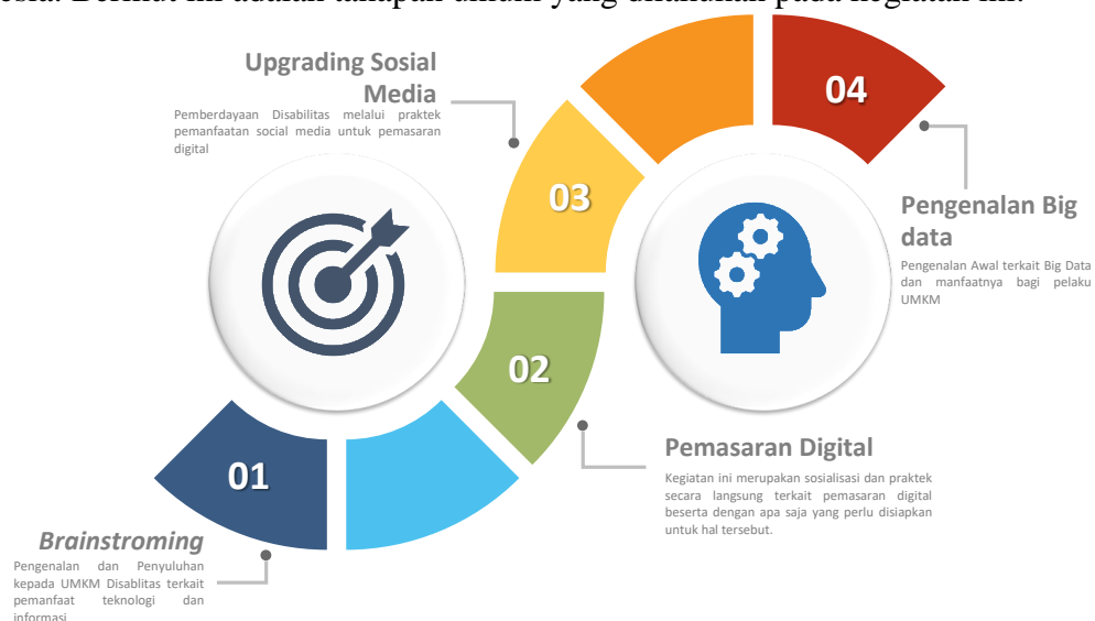
Gambar 2. Tahapan Umum Pelaksanaan Pemberdayaan Disabilitas

Metode penyelesaian permasalahan yang ditawarkan adalah berupa kegiatan pemberdayaan masyarakat/peningkatan perekonomian masyarakat melalui kegiatan Upgrading Social Media . Adapun bentuk pemberdayaan masyarakat adalah berupa pendampingan UMKM penyandang disabilitas yang memuat pendampingan UMKM dalam hal yaitu, (1) pengenalan teknologi dan informasi, (2) pemasaran digital, (3) peningkatan fungsi sosial media, dan (4) pemanfaatan big data. Empat unsur tersebut merupakan unsur penentu keberhasilan usaha. Dengan pengetahuan tersebut UMKM penyandang disabilitas dapat mengembangkan usahanya dengan skills yang memadai sehingga dapat bersaing dengan pengusaha lainnya sehingga dapat terciptanya perekonomian yang inklusif. Perekonomian yang mewadahi penyandang disabilitas sebagai salah satu kelompok marginal untuk dapat berkontribusi terhadap perekonomian Indonesia. Berikut ini adalah tahapan umum yang dilakukan pada kegiatan ini.