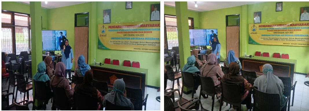
Gambar 1. Tim PPM FEB Unipa Surabaya menjelaskan tentang pentingnya legalitas usaha.

Dokumentasi pelaksanaan program pengabdian kepada masyarakat.