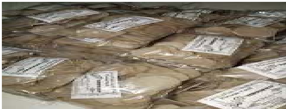
Gambar 4 Hasil Olahan Usaha Kecil