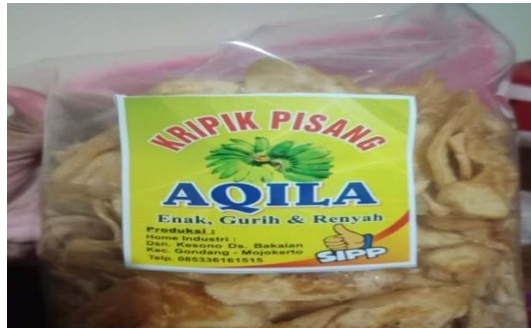
Gambar 4. Desain packaging keripik pisang yang lama

lakukan, beliau bersedia untuk mendesain ulang packaging produk atau kemasan dari keripik pisang dengan bantuan dari kami. Desain packaging yang lama dan yang baru dari produk keripik pisang dapat dilihat pada gambar dibawah ini: