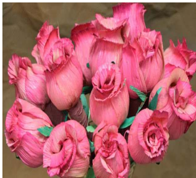
Gambar 4. Perangkaian

Perangkaian ini dilakukan dengan cara menyatukan pola satu dengan pola yang lainnya untuk membentuk sebuah kerajinan yang diinginkan. Alat-alat yang digunakan dalam pelatihan berupa, Klobot Jagung, Kawat/Bendrat, Pewarna Tekstil (aci), Gunting, Lem Tembak, Pot Bunga, Air Panas, Steroform, Ember.