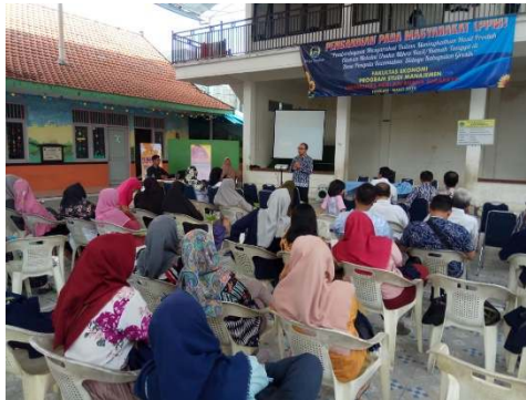
Gambar 1. Proses Pemberian Materi Kepada Masyarakat

bertahan semakin lama dengan mengacu pada salah satu oleh-oleh dari Kota Jogja yaitu gudeg yang sudah berinovasi menjadi gudeg kaleng dan dapat dinikmati dengan jangka waktu yang lebih lama sekaligus memiliki kepraktisan dari sisi pengiriman.