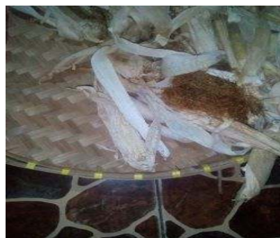
Gambar 3. Pengeringan Kulit Jagung

Pengeringan dilakukan dengan cara menjemur satu per satu klobot jagung dibawah terik sinar matahari. Pengeringan bertujuan untuk mengeringkan kulit jagung dari proses pewarnaan agar lebih mudah dibentuk untuk dijadikan bahan kerajinan.