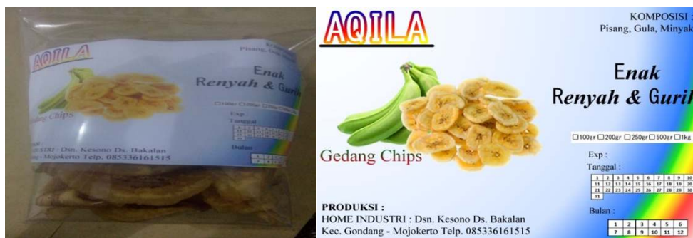
Gambar 5. Desain packaging keripik pisang yang baru