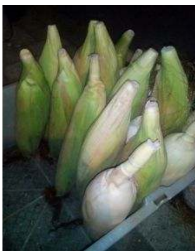
Gambar 1. Jagung

Sebagai bahan baku pembuatan kerajinan limbah kulit jagung ialah berupa hasil kulit jagung setelah dipanen yang sudah mengering dan layak untuk dijadikan bahan baku kerajinan. Pemilihan bahan baku ini perlu diperhatikan karena akan berpengaruh dalam proses pembuatannya.