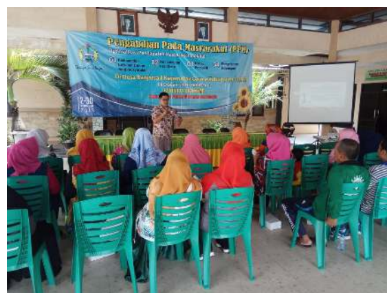
Gambar 1. Penyampaian Materi oleh Tim

Dalam pelaksanaan kegiatan juga diberikan pelatihan pemanfaatan teknologi melalui penerapan microsoft excel untuk membantu mempermudah melakukan pencatatan transaksi maupun pelaporan keuangan. Selama 1 bulan, mitra telah mampu untuk membuat laporan pengeluaran dan penerimaan kas, laporan dalam pembelian dan penjualan, laporan neraca atau posisi keuangan, dan laporan laba rugi serta mampu untuk menetapkan harga pokok penjualan.