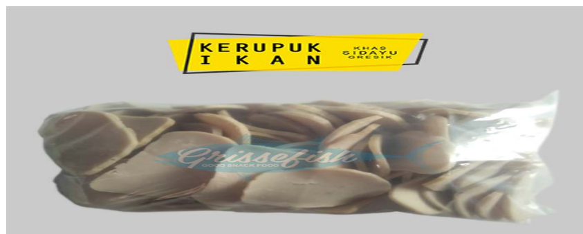
Gambar 5. Hasil Olahan Usaha Kecil