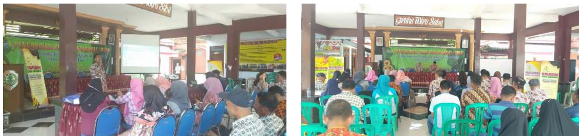
Gambar 1. Pelatihan Pembukuan Sederhana di Desa Kebontunggul, Kecamatan Gondang, Mojokerto

Transaksi-transaksi pengeluaran uang, penerimaan uang, penjualan dan pembelian barang dan jasa secara kredit serta transaksi non kas lainnya dalam tata buku tunggal dicatat dalam buku harian dan buku pembantu. Adapun hasil pelatihan ini adalah penggunaan buku harian dan buku pembantu, berikut contoh hasil buku harian: