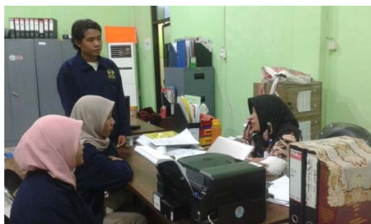
Gambar 2. Wawancara dengan Dinas Kesehatan Kabupaten Mojokerto