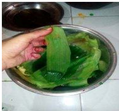
Gambar 2. Pewarnaan Kulit Jagung

Menurut Harry Abrido (2012) perendaman serat alam dengan NaOH bertujuan untuk meningkatkan ikatan antara serat dan matrik (pekat). Sedangkan senyawa asam asetat bersifat korosif dan berfungsi untuk mengawetkan, melunakkan sekaligus sebagai kualitas atau pengental. Dalam hal ini perendaman pewarnaan ditujukan untuk memperindah kulit jagung yang akan dijadikan kerajinan. Pewarnaan dilakukan dengan cara memasukkan bahan ke dalam bak yang bersih dan berisi air yang sudah dicampur dengan pewarna tekstil (aci). Setelah itu didiamkan selama 30 menit atau lebih agar warnanya meresap ke kulit jagung tersebut. Semakin lama direndam akan semakin bagus hasilnya.