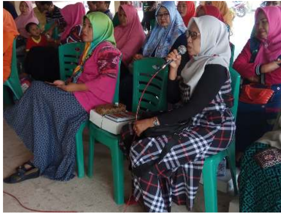
Gambar 2. Sesi Diskusi dengan Mitra