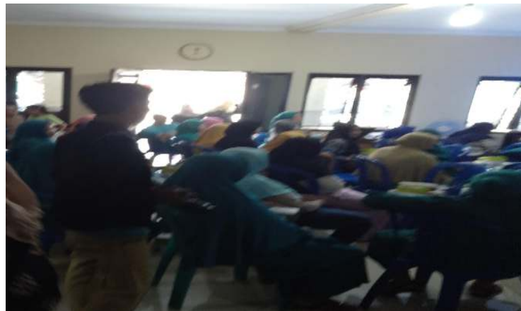
Gambar 1. Kegiatan penyuluhan dan pelatihan