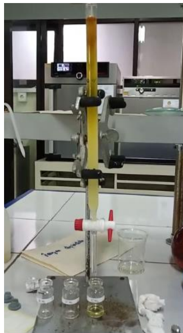
Gambar 1. Proses Fraksinasi dengan Kromatografi Kolom. Pelarut fase gerak etil asetat:metanol dengan perbandingan 4:1

daun kratom yang diambil dari berbagai wilayah di Malaysia memperlihatkan hasil yang berbeda (Lu et al., 2009). Maka dari itu, identifikasi senyawa kandungan metabolit sekunder dari kratom ini sangat perlu dilakukan untuk mendapatkan informasi yang tepat untuk mendapatkan isolat senyawa marker tersebut. Pada penelitian ini dilakukan fraksinasi dan identifikasi ekstrak daun kratom sebagai basic data dasar optimasi ekstraksi alkaloid untuk melakukan isolasi mitragynin. Serbuk daun kratom ( Mitragyna speciosa ) kering ditimbang sebanyak 4 g. Selanjutnya diekstraksi menggunakan metode maserasi selama 6 hari dengan menggunakan N-Heksan selama 1 hari atau 1 kali 24 jam untuk menarik senyawa yang bersifat non polar kemudian residu dilakukan ekstraksi kembali menggunakan metanol selama 5 hari atau 5 kali 24 jam untuk menarik senyawa yang bersifat polar.