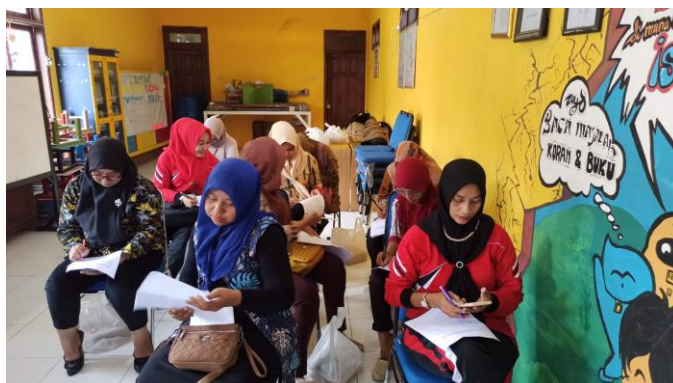
Gambar 7. Pengisian Angket Respon oleh Peserta

Dari hasil angket respon yang diberikan kepada peserta kegiatan, terlihat bahwa respon peserta positif terhadap sosialisasi metode ABA ini. Rata-rata pada setiap indikator, peserta memberikan jawabannya pada point 3 (setuju) ataupun 4 (sangat setuju). Bahkan peserta kegiatan memberikan saran untuk diadakannya kegiatan sosialisasi lanjutan yang membahas terkait APE (Alat Permainan Edukatif) ataupun cara mengajar yang baik untuk anak KB maupun TK.