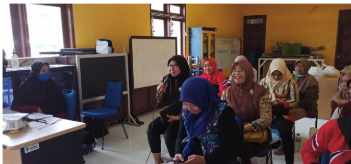
Gambar 6. Peserta mengajukan pertanyaan

Pada dasarnya saat mengajar anak dengan spektrum autisme, seorang pendidik harus memiliki pemahaman terlebih dahulu tentang spektrum autisme ( autism spectrum disorder ). Karena dengan mengetahui kondisi kekhususan dari spektrum autisme, seorang pendidik dapat memberikan penanganan yang lebih tepat terkait cara belajar anak dengan kondisi autisme. Sehingga dengan memberikan sedikit pemahaman tentang teknik pengajaran metode ABA ini, diharapkan Guru-Guru pengajar di KB maupun TK di wilayah Pakal Surabaya dapat membantu penanganan perilaku, proses belajar, dan membangun kemampuan anak untuk dapat hidup lebih baik.