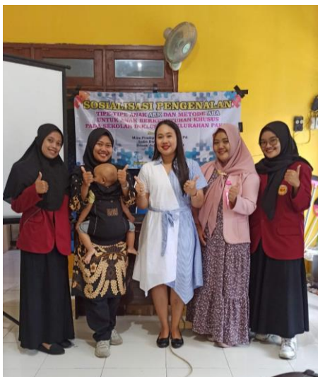
Gambar 2. TIM Pengabdian Masyarakat STKIP Bina Insan Mandiri

Pada penyampaian materi, narasumber menyampaikan tentang alasan anak dikatakan sebagai anak berkebutuhan khusus, tipe-tipe ABK, ciri-ciri dari setiap jenis ABK, sampai pada salah satu solusi untuk menangani anak ABK yaitu dengan menggunakan metode ABA. Rahayu (dalam Resmisari, 2016) mengungkapkan bahwa autisme adalah suatu gangguan perkembangan secara menyeluruh yang mengakibatkan hambatan dalam kemampuan, sosialisasi, komunikasi dan perilaku. Gangguan tersebut mulai dari ringan sampai berat dan muncul sebelum anak berusia 3 tahun.