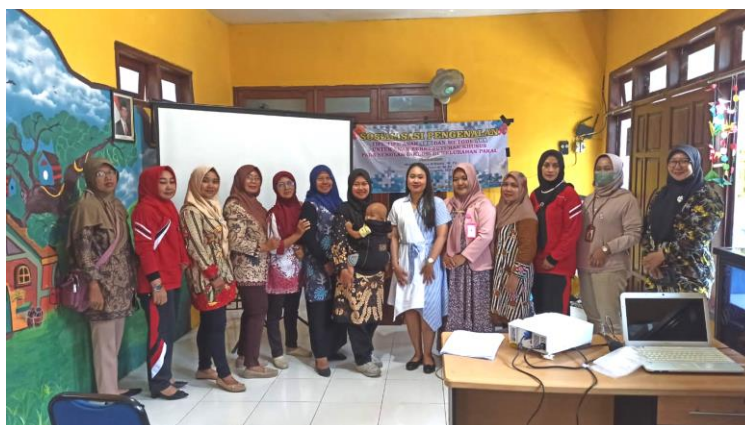
Gambar 8. Foto Bersama Narasumber dan Peserta

Dari hasil angket respon yang diberikan kepada peserta kegiatan, terlihat bahwa respon peserta positif terhadap sosialisasi metode ABA ini. Rata-rata pada setiap indikator, peserta memberikan jawabannya pada point 3 (setuju) ataupun 4 (sangat setuju). Bahkan peserta kegiatan memberikan saran untuk diadakannya kegiatan sosialisasi lanjutan yang membahas terkait APE (Alat Permainan Edukatif) ataupun cara mengajar yang baik untuk anak KB maupun TK.