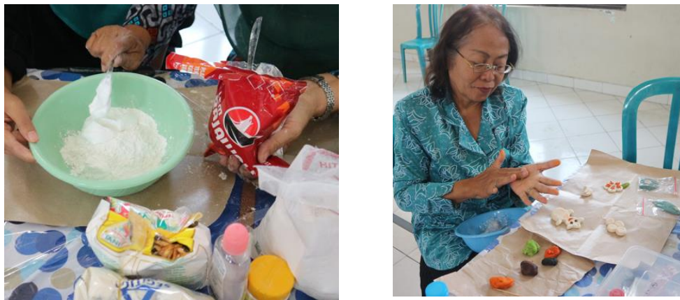
Gambar 4. Adonan dan proses pembentukan