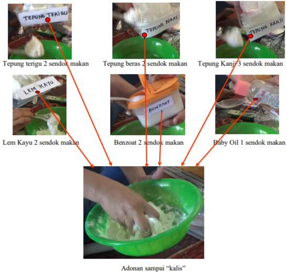
Gambar 2. proses pembuatan gantungan kunci

Bahan baku dan peralatan yang digunakan adalah: Tepung pati (kanji), Tepung gandum (terigu), Tepung beras, Lem kertas. Baby oil, benzoat, dan Pewarna, Pisau, nampan (“Telenan”), dan Peralatan pertukangan.