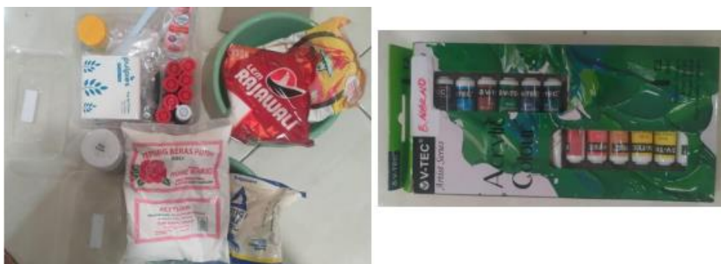
Gambar 3. Bahan baku gantungan kunci