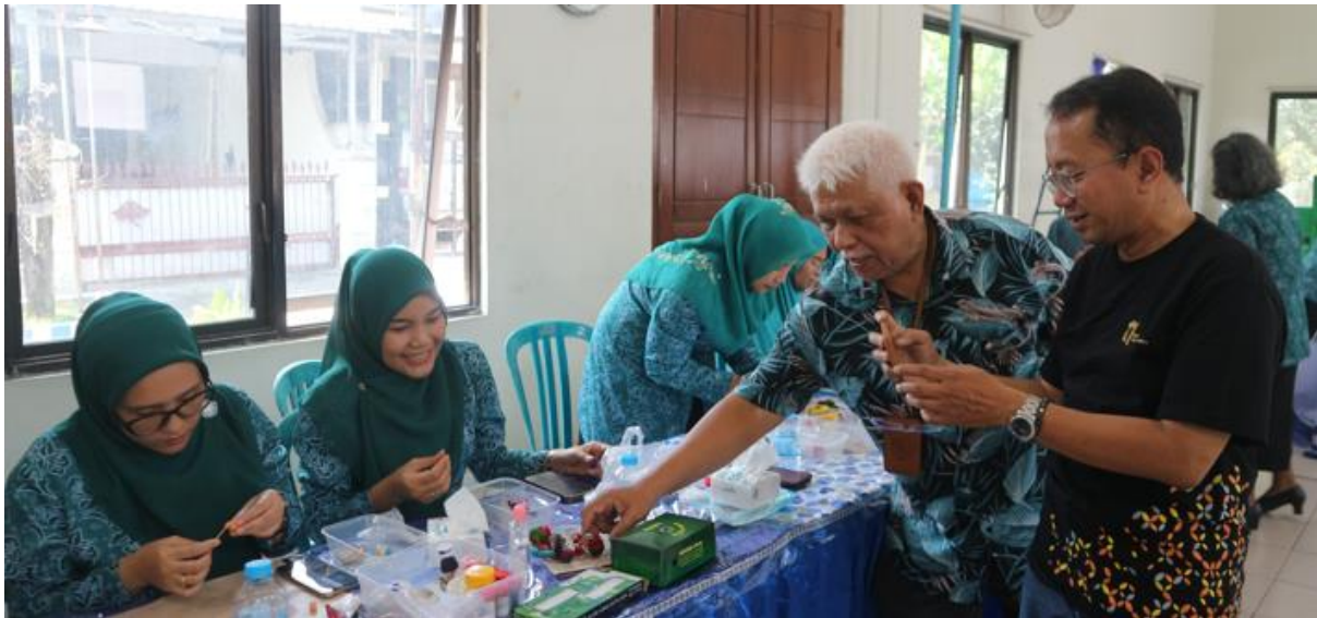
Gambar 6. Kunjungan LPPM UC (MONEV – Monitoring and Evaluation)