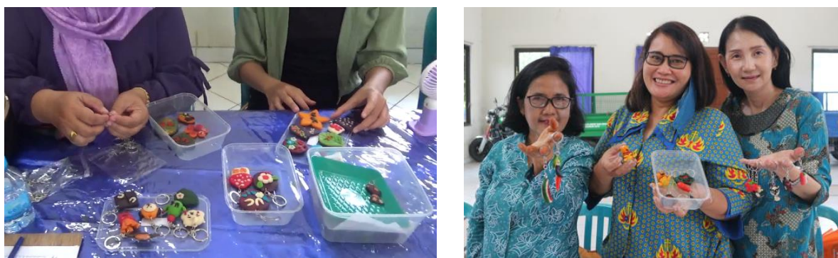
Gambar 5. Gantungan kunci

Gambar 5 menjelaskan tentang peragaan hasil karya gantungan kunci yang dibuat oleh ibu-ibu dan siap untuk dipasarkan. Rata-rata masing-masing peserta membuat 10 (sepuluh) unit gantungan kunci selama tiga jam pelatihan.