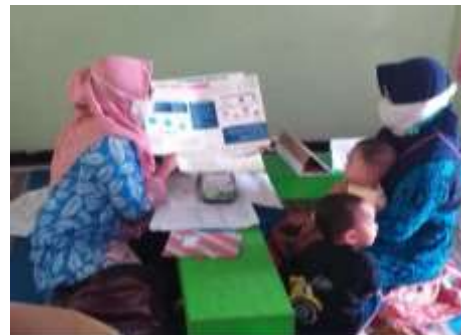
Gambar 1. Kegiatan praktik psikoedukasi pada ibu hamil dan ibu nifas

Pembelajaran online merupakan pembelajaran yang melibatkan perangkat media elektronik seperti komputer dan terhubung dengan jaringan internet (Rahayu et al., 2020). Peran teknologi informasi komputer dengan internet di dalamnya, telah mengubah persepsi dan metode belajar terutama di masa pandemi saat ini. Pelatihan tidak lagi dibatasi oleh lokasi dan waktu pelatihan (Makmur & Agunawan, 2021).