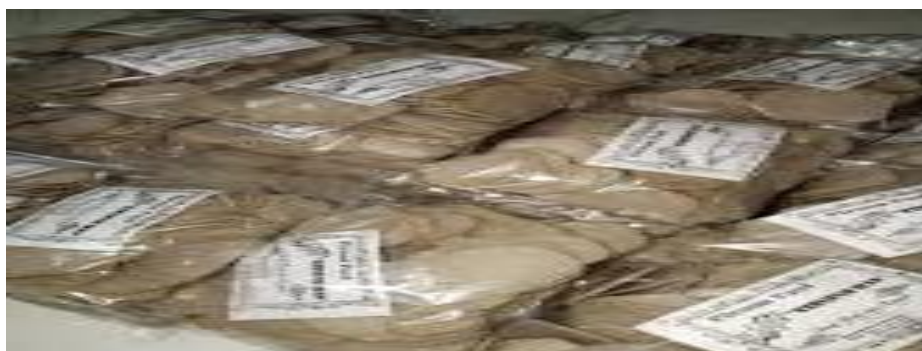
Gambar 4 Hasil Olahan Usaha Kecil