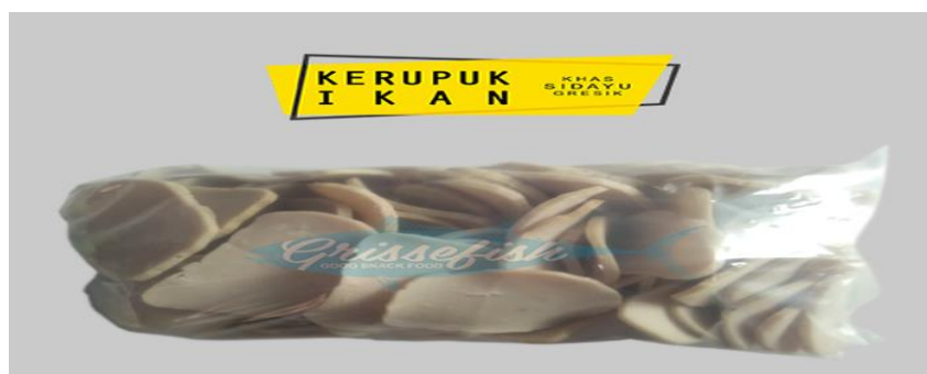
Gambar 5. Hasil Olahan Usaha Kecil