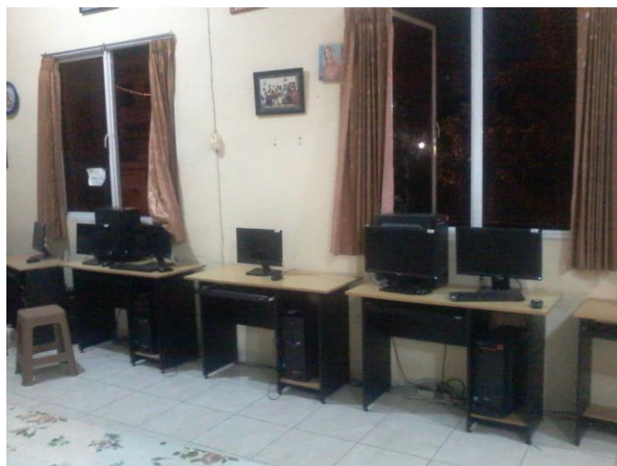
Gambar 3. Penataan Komputer Ruangan Pelatihan

Selain itu untuk dapat mengevaluasi pelatihan ini maka disusun angket untuk evaluasi yang akan dibagikan kepada seluruh peserta pada akhir pelaksanaan pelatihan sebagai bahan evaluasi hasil pelaksanaan pengabdian kepada masyarakat di PABK. Angket terdiri dari 9 (sembilan) item pertanyaan seperti tampak pada Tabel 1, sedangkan nilai isian angket terdiri dari 4 (empat) pilihan yang ditunjukkan pada Tabel 2.