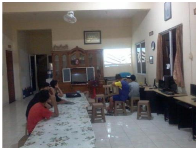
Gambar 2. Ruang Pelatihan

Instruktur juga menyiapkan ruang pelatihan, proyektor, dan komputer yang tersedia agar lebih efektif yang dapat dilihat pada Gambar 2 dan Gambar 3. Penataan ruangan dilakukan agar para peserta dapat menerima materi pelatihan secara maksimal dan instruktur dapat membimbing dan mengawasi latihan para peserta dengan lebih mudah dan maksimal.