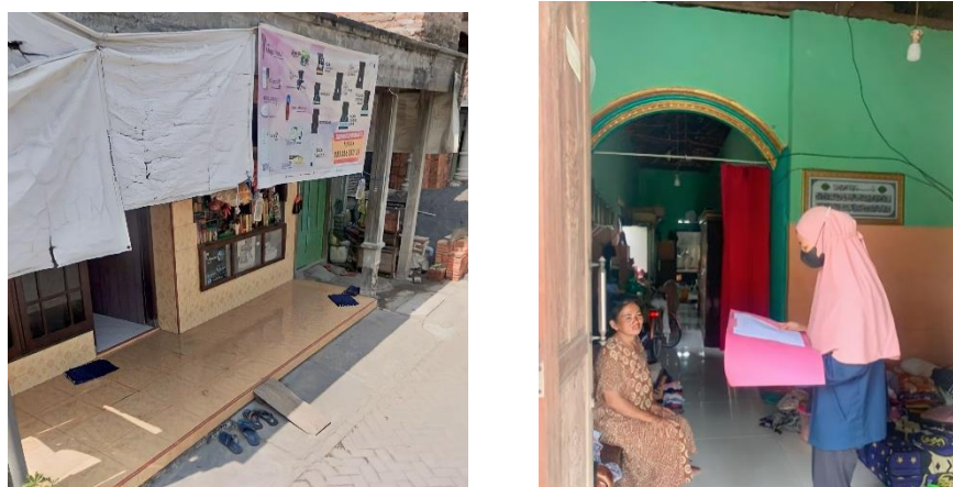
Gambar 2 Survey UMKM

Pada hari Rabu tanggal 28 Desember 2022 Tim KKN melanjutkan survey ke tempat pelaku usaha baru Poniti yang memiliki toko kelontong. Beliau mengira bahwa NIB hanya untuk pelaku usaha yang besar. Hal ini membuktikan bahwa masih banyak masyarakat yang tidak mengetahui bahwa toko kelontong adalah usaha yang harus memiliki NIB. Tim KKN memberikan informasi bahwa pembuatan NIB tidak harus datang ke OPD terkait yang dalam hal ini adalah Dinas Penanaman Modal dan Pelayanan Terpadu Satu Pintu (DPMPTSP) Kabupaten Sidoarjo tetapi dapat dilakukan secara online . Akhirnya tim membantu proses pendaftaran dan input data sampai terbitnya nomor induk berusaha melalui OSS di rumah ibu Poniti.