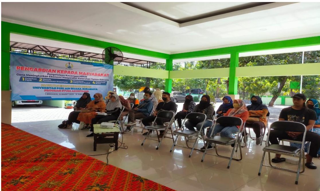
Peserta Digitalisasi Usaha