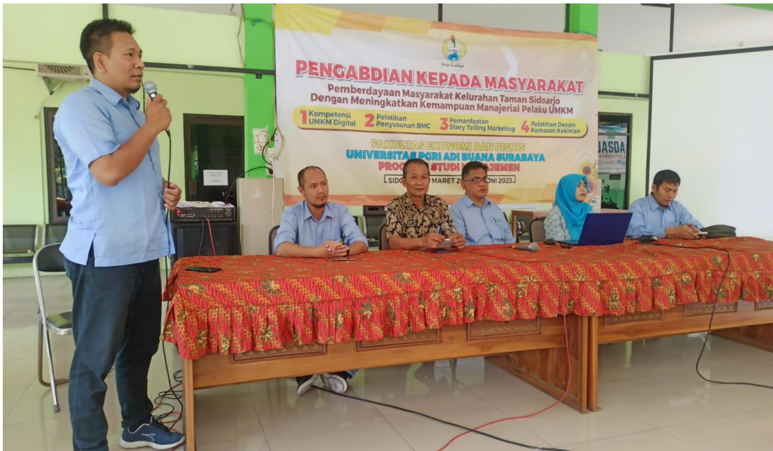
Pemateri Digitalisasi Usaha