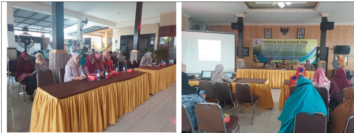
Gambar 1. Kegiatan PPM di Kelurahan Sepanjang