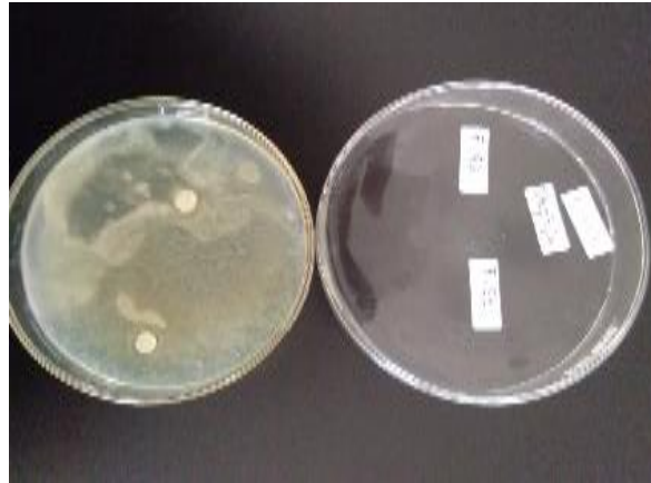
Gambar 3. Daya hambat mikroba pada F 50% (40 mm)

Berdasarkan hasil pengukuran diameter zona hambat pertumbuhan jamur Candida albican pada tabel 1. menunjukkan adanya aktivitas pada F4 50% sangat kuat lebih besar dari kontrol positif dengan nilai daya hambat 53 mm, pada F3 40% juga berada pada rentang sangat kuat dengan nilai 38 mm.