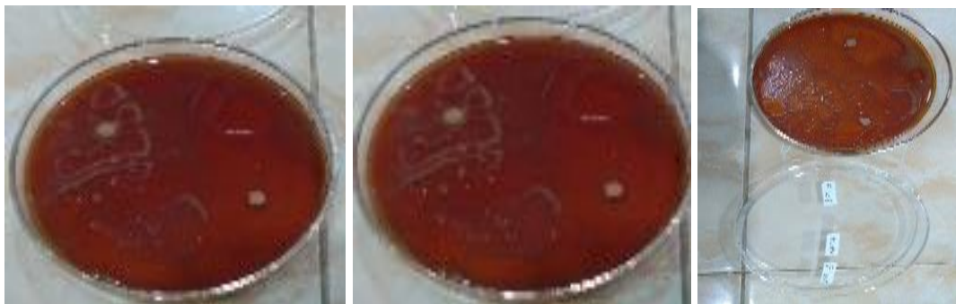
Gambar 4. Kontrol (+) dan Kontrol (-) terhadap Candida albican (52 mm dan 0mm);

Sedangkan pada F2 30% berada pada nilai 22 mm pada zona sangat kuat. F1 20% tidak ada daya hambat dengan nilai yang sama pada kontrol negatif yaitu 0 mm. Dari hasil tersebut didapatkan bahwa semakin besar konsentrasi, maka semakin besar pula zona hambat yang terbentuk