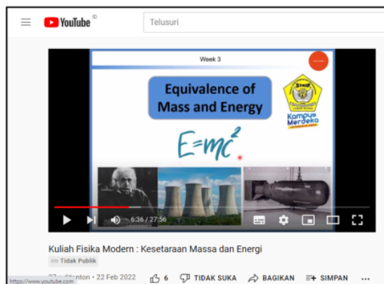
Gambar 1. Tangkapan Layar Video Pembelajaran Kesetaraan Massa dan Energi pada situs youtube.com

Video pembelajaran yang sudah rampung diupload ke situs youtube dan mahasiswa dapat mengakses video pembelajaran melalui tautan https://youtu.be/BbRgQFwiA0Y .