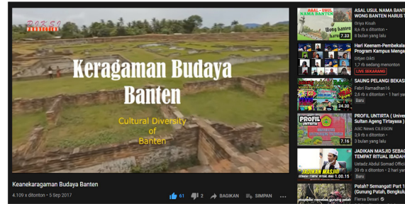
Gambar 2. Youtube sebagai Media Virtual dalam Menelisk Kebudayaan Banten.

Dengan menggunakan sistem media audiovisual dapat memudahkan proses pemahaman generasi muda dalam proses menelisk kebudayaan Banten. Adapun media audiovisual yang sering digunakan yaitu media aplikasi Youtube .