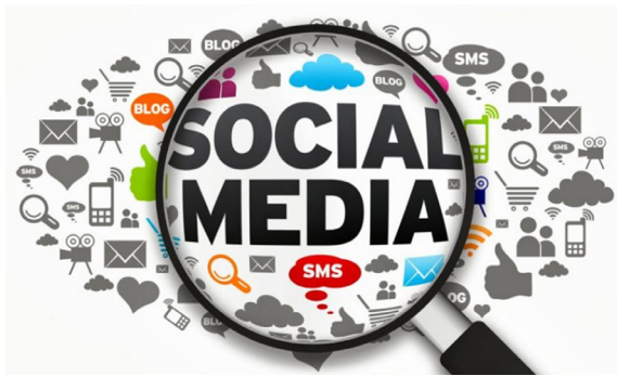
Gambar 1. Sosial Media sebagai Media Virtual dalam Menelisk Kebudayaan Banten

Melalui media jejaring sosial untuk menelisk kebudayaan Banten dengan menggunakan aplikasi yang mudah digunakan oleh generasi muda sehingga mereka mudah untuk melakukan proses menelisk kebudayaan dengan aplikasi yang sering di gunakan. Melalui media jejaring sosial juga dapat mudah melakukan share informasi kepada yang lainnya sehingga dapat menimbulkan proses interaksi pada saat menelisk kebudayaan Banten.