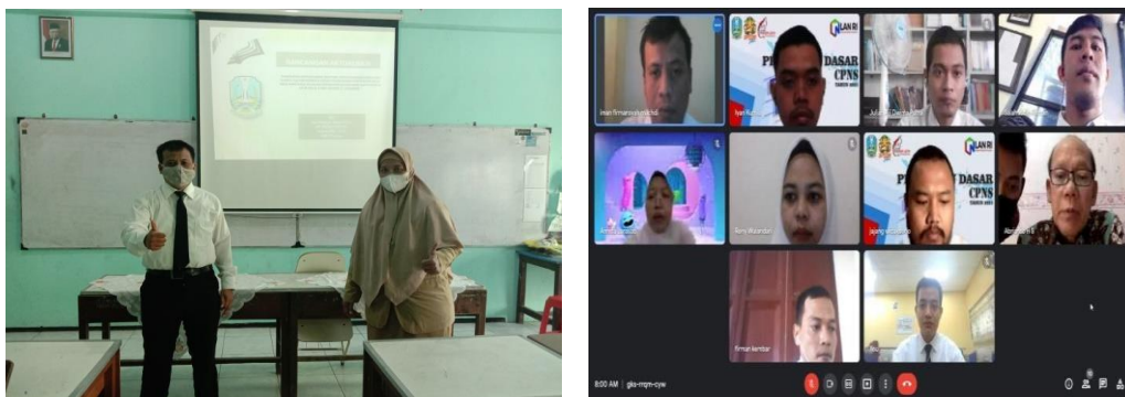
Gambar 1. Konsultasi dengan Mentor, Gambar 2. Konsultasi dengan Coach

Hasil capaian: a) Mentor memiliki persepsi yang sama terhadap kegiatan yang akan dilakukan, b) Kegiatan ini mendapatkan persetujuan dari mentor, c) Mendapatkan saran dan juga masukan dari mentor maupun coach yang telah ada, d) Mentor maupun coach memberikan motivasi dan dukungan untuk keberhasilan kegiatan.