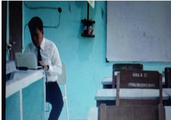
Gambar 7. Proses Penyelesaian Laporan

Hasil capaian: Laporan yang telah dibuat tersebut dapat tersusun dengan baik dan juga dapat dipertanggungjawabkan.