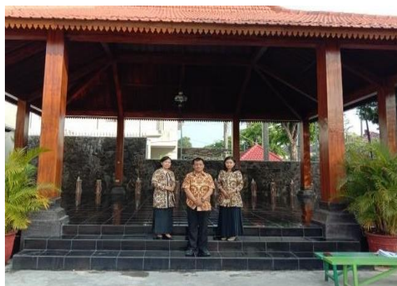
Gambar 4. Foto Bersama dengan Guru PPKn

Hasil capaian: a) Dapat berkomunikasi dengan baik dengan rekan kerja untuk menentukan waktu dan juga tempat koordinasi, b) Dapat paparan permasalahan yang ditemukan dan strategi yang akan dilancarkan, c) Mendapatkan kritik, masukan, saran terkait dan strategi yang akan dilancarkan dari guru mata pelajaran PPKn.