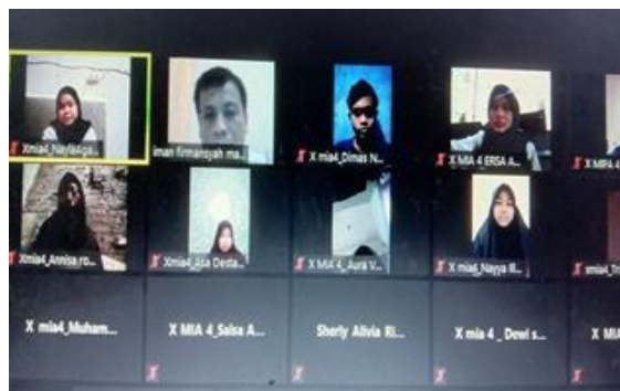
Gambar 6. KMB secara Online

Hasil capaian: a) Terlaksana dengan baik kegiatan pembelajaran seperti salam, menyanyikan kibar dan ice breaking secara online , b) Tersampainya dengan baik materi stimulus, materi dan media pembelajaran kepada peserta didik secara online , c) Peserta didik melakukan metode pembelajaran Mind Mapping di kelas secara online .