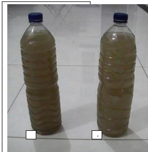
Keterangan : a. air baku sungai, b. air hasil pengendapan