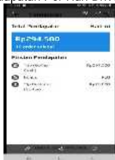
Gambar 1.3 pendapatan per hari driver gojek

Gambar di atas adalah hasil penelitian dari wawancara dan dokumentasi dimana penulis memintak screnshoot hasil pendapatan, bonus dan poin kepada driver gojek fulltime di kota Surabaya.