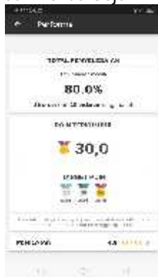
Gambar 1.2 poin dan bonus driver gojek