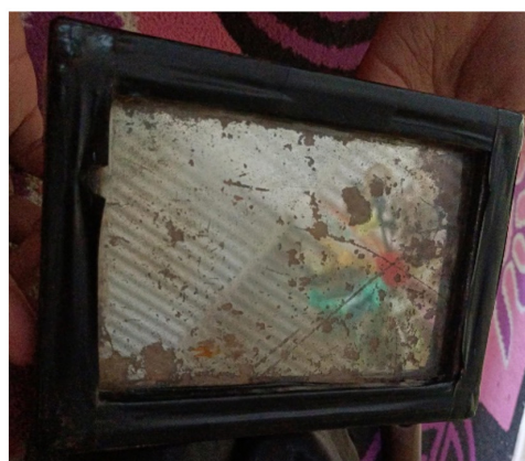
Gambar 4. Penggunaan Cermin tiga generasi dalam Seni Pertunjukan Betok.

Penggunaan cermin bukan hanya sebagai bumbu atau media tambahan, tetapi memiliki makna filosofis yang mendalam. Kaca sebagai cermin menjadi gambaran bahwa pemain adalah kita sendiri, mencerminkan kebutuhan akan introspeksi diri. Dengan menggunakan cermin, Seni Betok ingin menyampaikan pesan agar manusia tidak terlalu serakah, tidak terlalu mengumbar amarah, dan bersikap lebih introspektif terhadap diri sendiri. Kaca sebagai penghubung merupakan alat komunikasi, jendela kaca memungkinkan orang untuk melihat dan berkomunikasi satu sama lain dari dua ruangan yang berbeda.