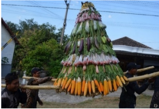
Gambar 8. Gunungan Sedekah Bumi

Makna Denotasi , gunungan sedekah bumi yaitu tumpeng yang disusun dari hasil bumi. Makna Konotasi , Gunungan Tumpeng di dalam ubarampe Kirab Merti Sumber , tumpeng mempunyai bentuk lancip dan tinggi yang mempunyai simbol keagungan Sang Kuasa. Di tengah gunungan buah berarti manusia bisa menerima kehidupan yang Tuhan berikan. Mitosnya , masyarakat percaya jika gunung itu lancip dan tinggi, berarti masyarakatnya bisa teguh menghadap Tuhan. Dari puncak gunung merupakan simbol kemakmuran, masyarakat dapat menerima kehidupan yang telah diberikan kepada Tuhan, mangkuk dan buah-buahan untuk diambil sebagai bentuk berkah bagi masyarakat Desa Krowe.