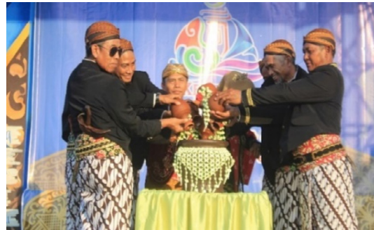
Gambar 3. Gentong

Makna Denotasi Genthong adalah wadah untuk menampung air atau wadah atau tempat yang khusus untuk menyimpan air. Konotasi , genthong dapat mempunyai arti seperti wadah pertahanan, kehidupan, dan kesederhanaan. Mitos , Masyarakat percaya bahwa genthong berarti hidup harus sederhana, dan harus bertahan dalam mencari sumber penghidupan.