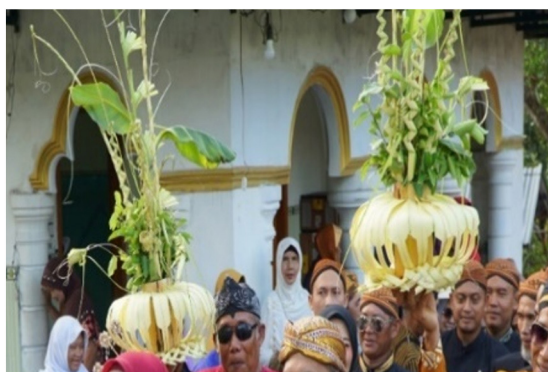
Gambar 6. Kembar Mayang (Sumber Dokumentasi Penelitian 2024)

Makna Denotasi kembar mayang artinya bunga kembar atau sama bentuknya yang terbuat dari rangkaian janur , debog , bunga lima warna, cawan gading, dan masih banyak lagi warna lainnya. Konotasi , kembar mayang mempunyai lambang persatuan dan bentuk kelompok utuh mempunyai lambang bahwa kehidupan bermasyarakat harus mempunyai jiwa yang erat, bersatu dan juga harus mempunyai rasa cinta kasih yang kuat. Mitos , masyarakat percaya bahwa pada rangkaian kembar Mayang pasti ada enam, jika angka enam diyakini sebagai simbol kekerabatan. kembar mayang merupakan rangkaian janur , debog , dan dedaunan yang mempunyai makna dan simbol persatuan, kekeluargaan pada saat masyarakat mengadakan Kirab Merti Sumber .