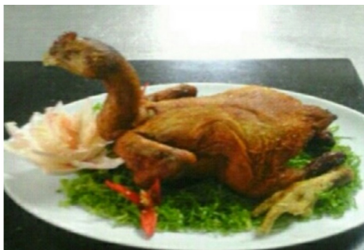
Gambar 9. Ayam Panggang

Makna Denotasi , seekor Ayam utuh yang kepalanya diikat, kakinya diikat, dan dikeringkan dalam api. Makna konotasi Ayam sing di bakar yang digunakan dalam Kirab Merti Sumber , artinya masyarakat akan tenang