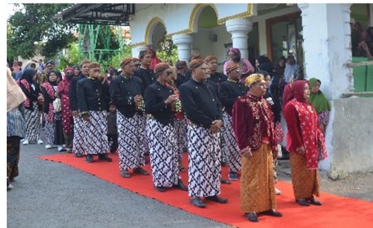
Gambar 1. Prosesi Kirab Merti Sumber Sumber Dokumentasi Penelitian 2024

Di bawah ini akan dijelaskan makna filosofi dalam ubarampe Kirab Merti Sumber berdasarkan data lapangan yaitu, observasi, dan wawancara. Kirab Merti Sumber dilakukan dengan diambilnya tujuh sumber mata air yang ada di Desa Krowe kemudian diarak bersama gunung tumpeng. Penyatuan tujuh air sumber dan andum berkah. Berikut ubarampe dalam Kirab Merti Sumber :