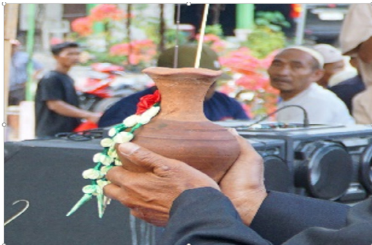
Gambar 2. Kendi

Makna Denotasi Kendi adalah wadah tradisional yang digunakan untuk menyimpan air oleh masyarakat Jawa. Konotasi , kendi berisi air dari mata air segar dan dapat melambangkan kebersihan, kesucian, atau keharmonisan. Mitos , mempunyai lambang pengendalian diri terhadap perilaku manusia dalam sehari. Kendi dalam Kirab Merti Sumber digunakan untuk wadah mata air yang akan digunakan dalam Kirab, artinya wadah untuk mengendalikan perilaku manusia dalam kehidupan sehari-hari, kesederhanaan dengan tradisi, dan kedekatan dalam keluarga atau masyarakat. Dari situ dapat dijadikan kendi untuk dijadikan alat ritual agar masyarakat Krowe dapat menjaga tingkah lakunya dan hidup dengan apa yang dimilikinya, serta dekat dengan masyarakat kiri dan kanan.