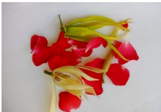
Gambar 5. Kembang Telon

Makna Denotasi yaitu bunga dengan tiga warna yaitu Mawar , Kenanga , dan Kantil . Makna Konotasi Kembang Telon adalah obat di Kirab Merti Sumber . Bunga ketiga yaitu bunga Mawar melambangkan kehidupan di dunia ini yang mekar bagaikan bunga Mawar yang indah. Hidup ini penuh dengan rintangan dan cobaan yang harus dihadapi. Kenanga itu bebas yang artinya mempunyai kebebasan bergerak. Kantil melambangkan manusia tidak bisa lepas dari Sang Pencipta, artinya mencapai apapun harus melalui doa kepada Sang Pencipta. Mitos , Kembang telon dipercaya oleh masyarakat Kirab Merti Sumber untuk mengirimkan nenek moyang mereka dan mungkin merupakan simbol permohonan untuk membersihkan dan mensucikan sumber air. Kembang ketiga ini juga untuk mengutus nenek moyang kita dan marilah kita mengingat Tuhan.