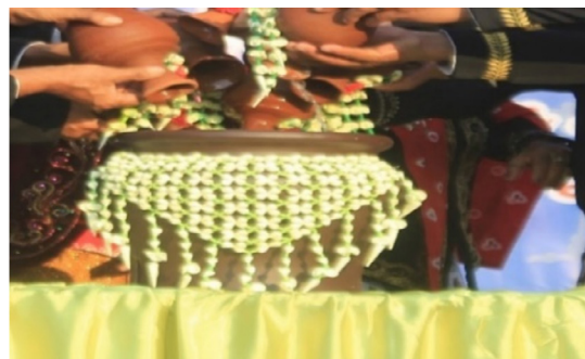
Gambar 7. Kembang Melati

Makna Denotasi , bunga berwarna putih yang dipotong untuk hiasan. Makna Konotasi , bunga Melati putih mempunyai lambang sakral dan halus, baunya yang harum melambangkan kepekaan. Filosofi dari sumber Melati adalah manusia harus suci, lemah lembut, dan peka terhadap lingkungan. Mitos , dari hasil penelitian bunga Melati di Kirab Merti Sumber , bunga Melati yang berwarna putih dan harum diyakini memiliki makna sebagai teladan hidup.