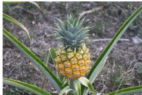
Gambar 10. Nanas