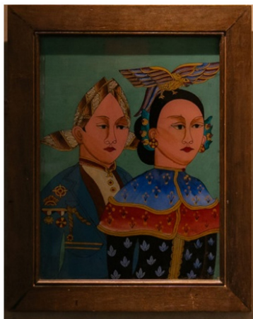
Gambar 3. Loro Blonyo, 1950. Anonim. Cat minyak di atas kaca.