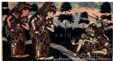
Gambar 2. Dewi Sinta, Trijata, dan Sang Hanoman membawa cincin Sang Rama, Hanoman shows Rama's ring to Shinta and Trijata, 1960. I Ketut Sekar. Cat minyak di atas kaca. 62cm x 42cm

Berdasarkan hasil yang telah dipaparkan pada tabel di atas, dipilih dua karya seni lukis kaca yang menarik untuk dibahas secara lebih lanjut. Berikut lukisan-lukisan tersebut: