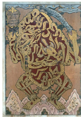
Gambar 4. Srabad Rihul Ahmar, 1955. Raden Saleh. Cat minyak di atas kaca.

Secara historis Loro Blonyo merupakan wujud percampuran antara kepercayaan lokal dengan nilai-nilai kerajaan Jawa yang menjadi simbol penting di dalam rumah tangga masyarakat Jawa. Secara estetika, Loro Blonyo merupakan representasi keindahan seni tradisional yang menyimpan makna di setiap detail yang ada.