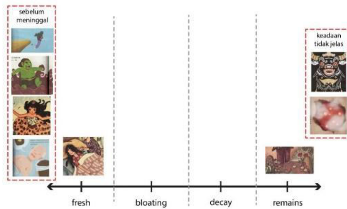
Gambar 2. Seluruh ilustrasi kematian klinis dalam skala penguraian tubuh

Dalam konteks kematian non-klinis (tran-sformasi dan transposisi), penggambaran kema-tian masing-masing dibagi menjadi dua