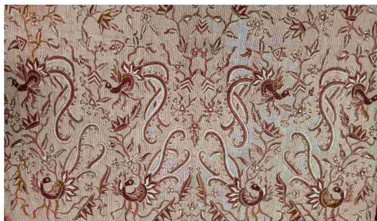
Gambar 2. Motif batik tulis Mijitimun Trenggalek

b. Motif Batik tulis Mijitimun, Trenggalek Hasil karya yang diciptakan oleh ibu Tie Poek, penulis memilih salah satu karya sebagai objek penelitian yaitu motif Mijitimun, karena motif ini merupakan motif klasik yang telah ada berkisar tahun 1962-an (Dwi SEPTA RAHAYU, 2017: 35) dan yang diciptakan oleh ibu Tie Poek saat ini merupakan pengembangan dari motif Mijitimun yang lalu. Pada motif ini, yang terinspirasi dari biji-biji mentimun yang merupakan tanaman yang sangat populer dan tumbuh dimana saja di kota Trenggalek yakni, sayur yang berupa buah mentimun yang terdapat biji-bijinya. Pembuatan motifnya bukan pada buah mentimunnya, tapi pada penyampaian motifnya melalui biji mentimun yang dikomposisikan dengan burung bekisar dan bunga cengkeh.