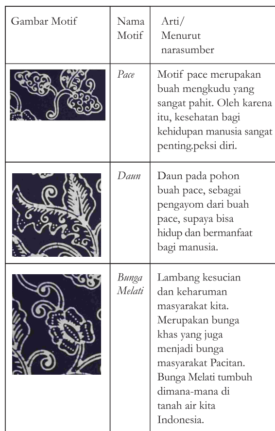
Tabel 4. Motif Batik Tulis Pace galaran , menurut narasumber.

Hasil wawancara peneliti dengan narasumber hari Rabu tgl 22 Mei 2018.