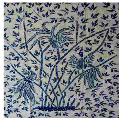
Gambar 3. Motif batik tulis Pring Sedapur, Magetan

a. Motif batik tulis Pring Sedapur, Magetan Motif Batik tulis Pring Sedapur, Magetan, merupakan motif yang sangat terkenal di Magetan. Di bagian bawah Pring terdapat rumput yang berjejer rapi dan dipagari dengan batu-batuan. Motif ini mengandung makna bahwa dalam sebuah kehidupan, manusia adakalanya harus menyendiri untuk merenungkan diri dan mawas diri. Maka dari itu, terkadang harus keluar dari kerumunan untuk memantapkan jati diri. Makna tersebut memberikan pembelajaran bahwasanya manusia harus meluangkan waktu untuk merenungkan diri agar kedepannya lebih baik. Motif ini menggunakan tambahan isen-isengalaran pada batu dan burung Jalak Lawu pada dasar kain batik.