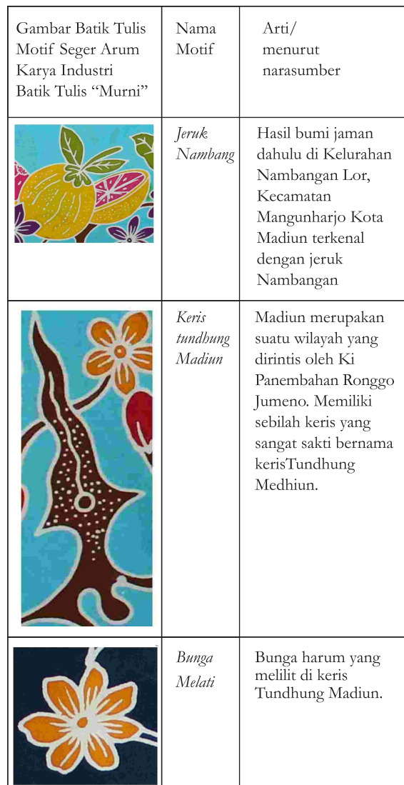
Sumber: Ristina Wahananing Safitri (2017:58).