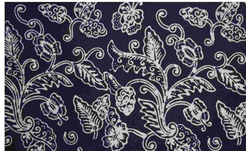
Gambar 4: Motif Batik tulis Pace galaran , Pacitan

Batik Pace galaran, motif utama buah Pace yang dibuat berselang seling dengan daun, bunga dan buah pace. Obyek bunga, daun, buah pace ditaruh di berbagai tempat, dan mempunyai maksud sebagai ciri khas kota Pacitan. Kabupaten Pacitan, penuh dengan tumbuhan pace, sepanjang jalan-jalan kota dan halaman-halaman rumah-rumah penduduk. Tanaman buah pace, di tanam penduduk karena berma Menggunakan pewarna alami dari daun mangga, warna merah muda didapat dari yang dikunci dengan tawas dan tunjung.