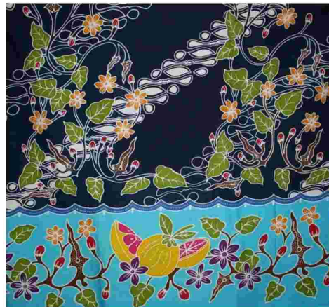
Gambar 1: Motif batik tulis Seger Arum asal Madiun

Asal mula terciptanya motif Seger Arum terinspirasi dari hasil bumi zaman dahulu di Kelurahan Nambangan Lor Kecamatan Mangunharjo Kota Madiun terkenal dengan jeruk Nambangan, jadi kata Seger tercipta dari jeruk Nambang and Arum tercipta dari harumnya bunga melati yang melilit keris Tundhung Madiun. bentuk dari motif Seger Arum, ada tiga bentuk dalam satu motif yaitu: motif jeruk nambangan bentuknya bulat seperti jeruk, bunga melati dan keris Tundhung Madiun. Keris Tundhung Madiun merupakan icon dari kota Madiun sendiri.