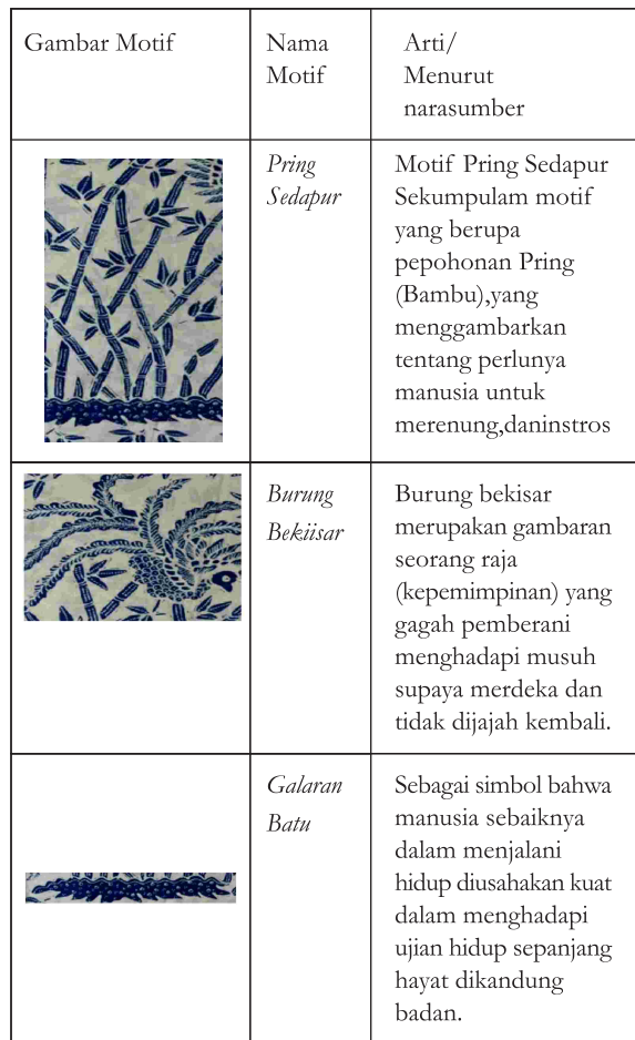
Tabel 3. Motif Batik Tulis Pring Sedapur , menurut narasumber

Hasil wawancara peneliti dengan narasumber. Pada hari Rabu tgl 22 Mei 2018.