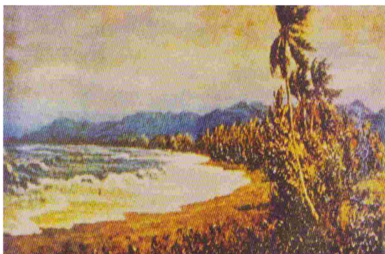
Gambar 2. Mas Pirngadi. Pelabuhan Ratu. 1927. Cat Minyak pada kanvas.

pemandangan alam yang dilalui sungai sebagai latar depan, hampir menguasai bidang kiri dan kanan kanvas, sungai yang berkelok ini membagi dua bagian sawah kanan dan kiri menjadi seimbang dikarenakan pengaturan warna dan cahaya yang disapukan pada sawah yang menguning serta sawah pada bagian kiri dengan warna yang lebih gelap. Peletakan batu pada sungai memberikan irama dan arah perspektif sampai ke garis horizon, bagian ini warna maupun sapuan terlihat lebih tegas dapat dikatakan sebagai latar depan, kemudian latar selanjutnya dapat kita lihat bukit dengan tebing mempunyai warna yang lebih terang karena adanya cahaya dari matahari yang jatuh di atasnya sekaligus ada bayangan yang jatuh di bawahnya, maupun rumpun di sebelah kiri dan latar selanjutnya berupa gunung gunung dengan menggunakan warna yang lebih pudar, sehingga hanya memberikan kesan gunung dari kejauhan. Bukit dan tebing di atas garis horizon menjadi point of interest dari komposisi lukisan ini, dengan letak di tengah tengah menyeimbangkan ke dua sisinya serta tinggi puncak tebing yang berbeda yaitu di sebelah kiri lebih tinggi, sehingga membentuk garis diagonal ke arah kanan. Garis diagonal yang terbentuk pada puncak bukit yang berlawanan arah dengan garis bukit di sebelah kiri maupun dari garis gunung yang mengarah ke kanan, sehingga komposisi yang terbentuk menjadi selaras secara keseluruhan. Penggarapan yang sangat teliti menghasilkan paduan warna dan komposisi yang memberikan kesan sejuk dan tenang.