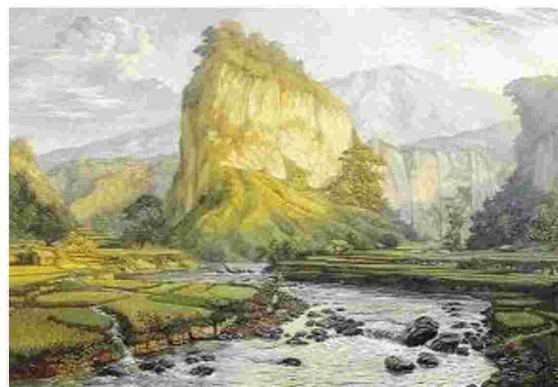
Gambar 1. Wakidi. Mountain Landscape. 139.5 x 197 cm. Cat Minyak pada kanvas.

Penelitian ini adalah penelitian sosial-humaniora yang menggunakan metoda kualitatif. Teknik pengambilan data dengan menggunakan penelitian kepustakaan ( Library research ), bersumber dari literatur kepustakaan, dan metode eksperimen. Pengumpulan data dalam penelitian kualitatif ini dilakukan dengan tahapan pengamatan, wawancara, pendokumentasian dalam bentuk audiovisual (CRESWELL, 2014, p. 222). Sampel penelitian menggunakan karya seni lukis tahun 1930-an yang dibuat oleh seniman Indonesia dan seniman barat yang datang ke Indonesia. Beberapa karya dari seniman Indonesia yang dianggap mewakili pada tahun 1930 an adalah Wakidi, Mas Pirngadi, Abdullah Soerjo Soebroto. Adapun pembahasannya adalah: