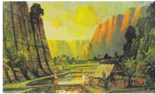
Gambar 4. Leonard Eland “lembah Arau”, cat minyak pada kanvas, 60 x 100 cm.