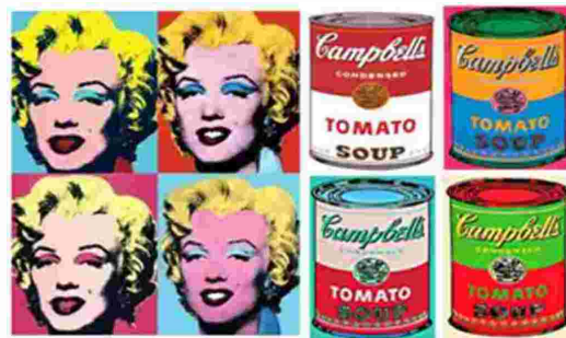
Karya Seni Grafis Pop Art : Andi Wahrhol; Marilyn Monroe, Campbells Art.with.mr sleuer.com

yang di pakai untuk ilustrasi dan promosi produk iklan. Teknik cetak saring/silk screen berasal dari daratan China yang kemudian berkembang di Eropa abad ke 15, menandai perkembangan teknik cetak saring adalah setelah perang dunia ke-2. Teknik ini berkembang luas di Amerika setelah dikembangkan oleh seniman Amerika Andi Warhol dan menjadi salah satu media pengusung gaya seni pop art.