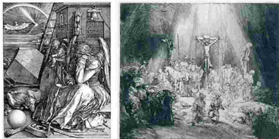
Kiri ke Kanan Karya Albrecht Duerer dan Karya Rembrandt

Teknik cetak yang pertamakali ditemukan adalah tehnik cukil kayu/woodcut memakai medium kayu sebagai matriks atau plat acuannya. Teknik pertama ini yang digunakan dalam tradisi seni grafis sebelum ditemukannya teknik-teknik lain. Cukil kayu ini telah lama digunakan untuk ornamen tekstil, kemudian juga diterapkan dalam kitab berisi doa sang Budha di China paruh awal abad-5. Kitab tersebut bernama diamond sutra, berisi cetakan cukil kayu dan tulisan. Selanjutnya teknik mencetak ini memasuki wilayah Eropa melalui negara Jerman tahun 1400, lalu mengalami masa perkembangan. Nama Gutenberg dikenal sebagai penemu mesin cetak pertama yang berhasil menciptakan metal letter dan teknik linocut yang dapat menghasilkan gambar dan teks tulisan secara bersamaan. Contoh Karya Grafis Eropa Klasik.