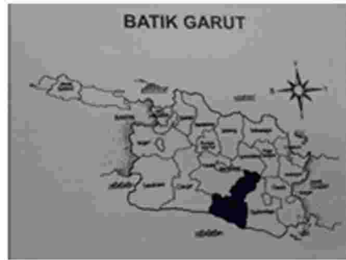
Gambar 1. Lokasi Garut

Garut merupakan kawasan di Jawa Barat yang memiliki karakter geografis pegunungan sekaligus laut yang berada di Pesisir Selatan Pulau Jawa berhadapan dengan Samudra Hindia. Akses utama menuju Garut melalui jalan darat. Oleh karena itu kebudayaan-kebudayaan baru masuk melalui jalur pegunungan. Karakter geografis Garut pegunungan dikenal dengan istilah Swiss van Java karena cuacanya yang nyaman serta pemandangannya yang indah.