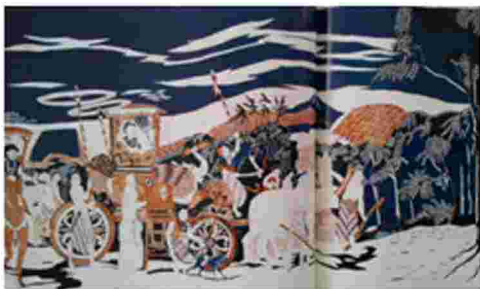
Gambar 9. Batik Pajajaran

Terdapat pula keinginan menjadikan kain batik serupa dengan kanvas. Muncul motif batik Pajajaran yang memperlihatkan visualisasi kereta kencana yang dinaiki oleh raja serta diiringi oleh para prajurit serta penasehatnya. Motif tersebut tampak pada motif Pajajaran di bawah ini. Warna yang digunakan masih menggunakan warna yang tidak menyolok yaitu putih, coklat, dan biru tua.