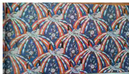
Gambar 10. Merak Ngibing

Duakain batik yang pertama dikerjakan oleh pengrajin di Pegunungan atau istilah untuk membedakan dengan batik yang dibuat oleh pengrajin di Pesisir. Melalui visualisasi terlihat bagaimana detailnya abentuk merak yang distilasi. Pada motif Merak ngibing bagian atas berwarna biru sedangkan pada bagian bawah berwarna kecoklatan. Untuk Batik coklat menggunakan motif dari renda pada masa kolonial pada bagian bawah kain. Menyerupai renda pinggiran kain masyarakat Eropa abad ke 18. Motif merak yang digunakan seakan-akan saling berhadapan menyilang, memperlihatkan Gerakan yang mesra. Batik pertama menggunakan warna biru dan coklat jingga. Terlihat pengulangan motif dengan bagian ujung kain terdapat motif tumpal kecil. Pengerjaan keduanya sangat detail dengan garis-garis halus.