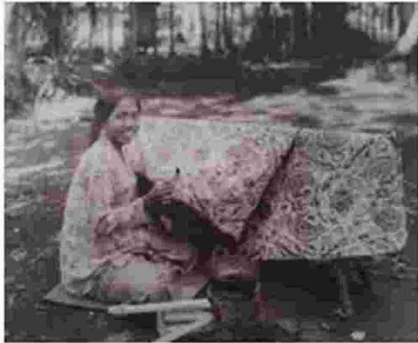
Gambar 3. Pembatik Garut Tahun 1920