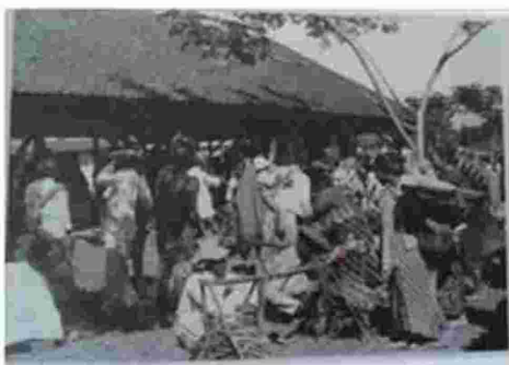
Gambar 4. Suasana Pasar di Garut Sekitar Tahun 1930-an, Terlihat Perempuan Menggunakankain Batik

Motif Batik Garut sangat beragam terdapat motif-motif yang memperlihatkan kesinambungan atau akulturasi dengan berbagai kawasan seperti batik keratin dari Surakarta atau Yogyakarta, maupun batik yang berasal dari kawasan pesisir pantai utara seperti kawasan Pekalongan dan Cirebon. Motif Batik Garut yang terlihat klasik seperti Batik Rereng. Selanjutnya pengrajin batik di Garut memperlihatkan kreatifitasnya dengan menambahkan unsur-unsur hewan, tumbuhan, maupun artefak lainnya yang ditemukan di Garut. Di kawasan Pesisir Selatan Garut berkembang motif yang dibuat dengan menampilkan binatang-binatang laut yang terlihat pada motif Aquarium. Warna-warna yang digunakannya menyolok dan berbeda dari warna khas batik Garut yaitu krem dan putih gading dengan warna coklat tanah kemerah-merahan.