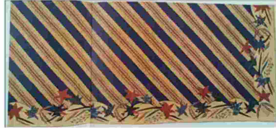
Gambar 5. Motif Parang Gandeng tahun 1950

Motif Batik Garut sangat beragam terdapat motif-motif yang memperlihatkan kesinambungan atau akulturasi dengan berbagai kawasan seperti batik keratin dari Surakarta atau Yogyakarta, maupun batik yang berasal dari kawasan pesisir pantai utara seperti kawasan Pekalongan dan Cirebon. Motif Batik Garut yang terlihat klasik seperti Batik Rereng. Selanjutnya pengrajin batik di Garut memperlihatkan kreatifitasnya dengan menambahkan unsur-unsur hewan, tumbuhan, maupun artefak lainnya yang ditemukan di Garut. Di kawasan Pesisir Selatan Garut berkembang motif yang dibuat dengan menampilkan binatang-binatang laut yang terlihat pada motif Aquarium. Warna-warna yang digunakannya menyolok dan berbeda dari warna khas batik Garut yaitu krem dan putih gading dengan warna coklat tanah kemerah-merahan.