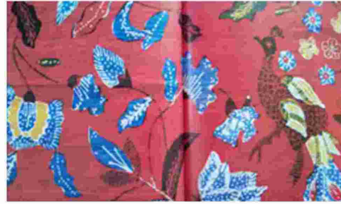
Gambar 17. Batik Garut Pesisir

Motif Batik Mojang Priangan sampel kedua terlihat masih menggunakan obyek burung merak dan bunga, tetapi semakin jauh dari detail motif sebelumnya. Motif bunga seakan-akan serupa dengan motif yang dikerjakan di daerah Pesisir Utara Jawa Barat yaitu di Cirebon dan Indramayu. Penggunaan warna merah sebagai warna dasar pun memperlihatkan bahwa batik ini merupakan batik baru untuk motif batik Mojang Priangan. Walaupun terdapat penurunan kualitas, tetapi terlihat usaha pengrajin untuk mengikuti selera masyarakat akan warna-warna yang cerah.