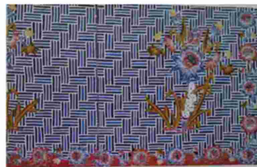
Gambar 7. Motif Bilik Papangkah

Salah satu motif batik Garut yang terkenal adalah motif bilikatau motif dinding dari bamboo. Motif ini awalnya berwarna coklat khas batik Garutan, kemudian berkembang dengan penambahan motif bunga seperti bagian dari motif buketan Pekalongan, dengan warna-warna yang beragam bahkan menyerupai keragaman batik Belanda atau Batik Encim. Contoh motif batik tersebut seperti terlihat di bawah ini.