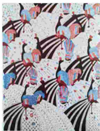
Gambar 13. Merak Ngibing Pesisir Garut

Motif Merak Ngibing kedua masih memperlihatkan keserupaan dengan motif khas Merak Ngibing yang dibuat di Pegunungan. Hanya saja jika diperhatikan secara seksama, telah kehilangan detail-detail pada bagian ekor merak, demikian pula pada bagian tubuh merak itu sendiri seakan-akan hanya memblok warna hitam. Secara keseluruhan terdapat penurunan kualitas pada motif Merak Ngibing di daerah Pesisir Selatan Garut.