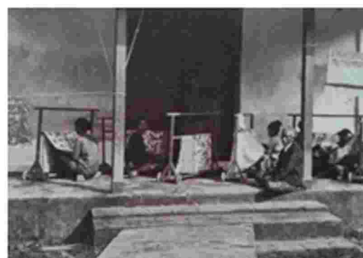
Gambar 2. Pembatik Garut di Daerah Perkebunan Waspada Tahun 1875

Berdasarkan sumber data lainnya diketahui bahwa kegiatan membatik telah berlangsung sejak masa abad ke-19. Beberapa bukti melalui foto di bawah ini memperlihatkan kegiatan membatik yang dilakukan oleh perempuan-perempuan Garut di lahan-lahan perkebunan seperti di daerah perkebunan Waspada pada tahun 1875 maupun foto perempuan yang sedang membatik pada tahun 1920. Selain itu penggunaan kain batik untuk kepentingan keseharian terlihat dari foto yang memperlihatkan aktifitas perempuan di pasar mereka menggunakan kain batik sebagai pakaian mereka. Hal tersebut mempertegas bahwa di wilayah Garut, kegiatan membatik merupakan kegiatan yang umum. Penggunaan kain batik di masyarakatnya mempertegasakan keberadaan pengrajin batik di Garut.