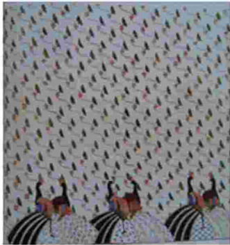
Gambar 12. Merak Ngibing Pesisir Garut

Pada Kain Batik Motif Merak Ngibing yang dibuat di Pesisir Garut memperlihatkan penggunaan warna yang ringan. Pada batik pertama dipadukan dengan motif lain. Nama Motif tersebut menjadi Motif Pegat Maru latar Rereng Kembang. Burung merak ditempatkan hanya pada bagian bawah. Berbeda dengan motif klasik Merak Ngibing.