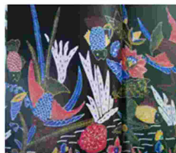
Gambar 8. Batik Garut Pesisir Motif Aquarium Garut