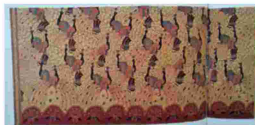
Gambar 11. Merak Ngibing