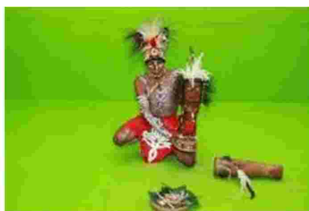
Gambar 1: Pembuatan Patung Karwar

Patung karwar atau korwar Papua telah menjadi koleksi Museum di Nationaal Museum van Wereldculturen, Museo di Storia Naturale dell Università di Firenze, Musee du Quai-Branly, Museum der Kulturen, Basel, Staatliche Museenn zu Berlin, The British Museum, de Young Museum, Museum of Fine Arts Boston, Yale University Art Gallery, Los Angeles County Museum of Aart, Brooklyn Museum seperti gambar berikut :