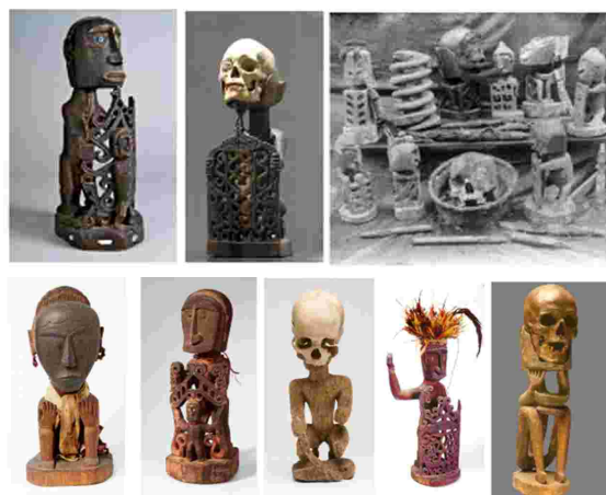
Gambar 2. Patung Korwar koleksi Museum

Patung karwar atau korwar Papua telah menjadi koleksi Museum di Nationaal Museum van Wereldculturen, Museo di Storia Naturale dell Università di Firenze, Musee du Quai-Branly, Museum der Kulturen, Basel, Staatliche Museenn zu Berlin, The British Museum, de Young Museum, Museum of Fine Arts Boston, Yale University Art Gallery, Los Angeles County Museum of Aart, Brooklyn Museum seperti gambar berikut :