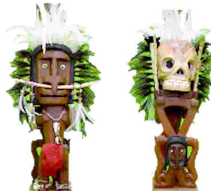
Gambar 4. Patung Karwar

simbol agar tidak menendang anggota keluarga yang lain untuk ikut meninggal. Tangan menopang dagu berarti simbol seorang pemikir. Suku biak dalam melakukan sesuatu selalu memikirkan dampak dan manfaat bagi dirinya maupun orang lain (JANUAR, 2018).