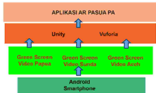
Gambar 6. Kerangka Kerja Marker AR Patung Karwar 4.0 dalam Aplikasi AR PASUA PA

Pemahaman kebutuhan pengguna (penikmat seni budaya dan pembelajar) sangat penting untuk dinyatakan sebagai masalah dan peluang. Fitur dari AR PASUA PA menjawab kebutuhan pengguna sebagai jembatan antara masalah dan solusi. AR PASUA PA dibuat untuk menjawab permasalahan seniman, penikmat dan pembelajar seni budaya. Berikut kerangka kerja Marker AR Patung Karwar 4.0 dalam Aplikasi AR PASUA PA: