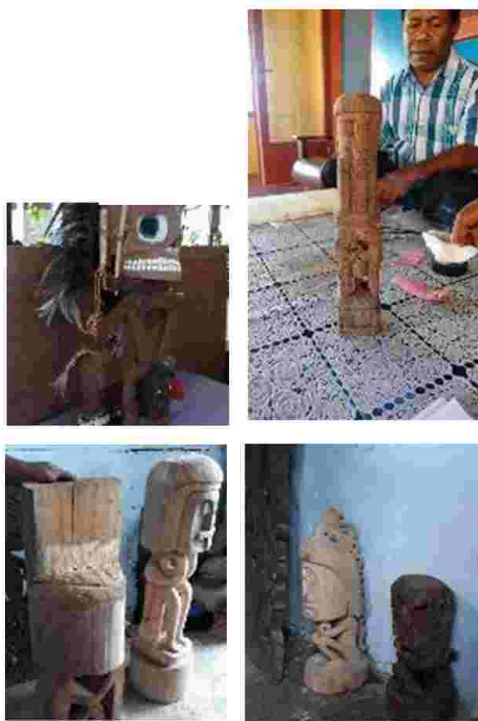
Gambar 3. Patung Karwar ukuran 50 cm dan ukuran 20 cm

menjauhkan penyakit. Karwar atau Korwar adalah patung manusia dalam posisi duduk atau berdiri dengan kepala yang besar. Amfyanir Karwar adalah patung yang menyerupai manusia yang telah meninggal dan telah diberikan roh dari orang yang sudah meninggal atau roh leluhur (JANUAR, 2018).