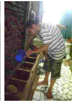
Gambar 12. Proses penyiraman untuk merendam tanah liat

Untuk proses perendaman, tanah liat dihancurkan dengan cara meremas-remas yang disertai dengan gerakan tangan menekan, dan memutar atau membelit tanah liat sehingga menjadi plastis. Cara ini dilakukan berulang kali disertai dengan mencampur air secukupnya, sehingga butiran-butiran kasar terpisahkan dan melebur, kemudian tanah liat tersebut disaring sebanyak empat kali penyaringan. Dalam proses penyaringan menggunakan saringan dengan rongga yang cukup kecil dan padat, sebanyak 3 buah dengan tujuan agar kotoran yang terdapat pada tanah liat dapat terpisah secara sempurna. Proses perendaman tersebut merupakan tahap