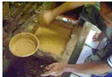
Gambar 16. Pengendapan tanah liat setelah melalui proses penyaringan