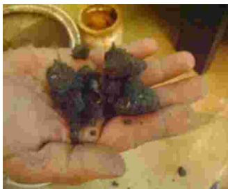
Gambar 10. Tanah liat warna hitam dari daerah Jeneponto, Jenis tanah liat Grumusol