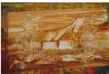
Gambar 27. Hasil lukisan tanah liat berbentuk objek rumah adat Toraja Tanah liat pada kertas, 20 x 30 cm

Dalam melukis menggunakan pewarna tanah liat memerlukan kecepatan dan kecekatan membuat objek, oleh karena bahan tanah liat memiliki sifat yang mudah kering. Pada tahap akhir (finishing), pemberian bahan vernis atau pilox clear yang tujuannya untuk mengawetkan warna tanah liat pada lukisan agar daya tahan