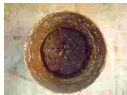
Gambar 2. Tanah liat warna coklat dari daerah Maje'ne, Jenis tanah Latosol

Tanah liat yang digunakan Zainal Beta dalam pewarnaan karya lukisannya merupakan jenis tanah liat endapan (tanah liat sekunder). Oleh karena tanah liat tersebut memiliki sifat yang lebih plastis dan berbutir halus. Tanah liat endapan biasa juga disebut batuan sedimen