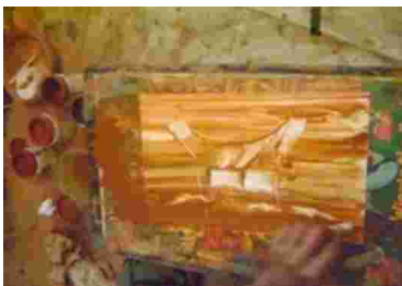
Gambar 26. Proses melukis melalui pemberian efek gelap terang