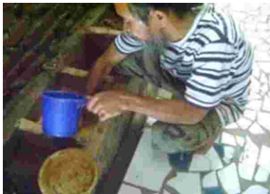
Gambar 14. Proses perendaman setelah tanah liat dihancurkan Sumber: Dokumentasi Pribadi, 2012.

Pada tahap penyaringan terakhir, tanah liat direndam dengan kapasitas air yang cukup banyak yakni minimal satu ember berukuran medium, bertujuan agar material tanah dan air mencapai keseimbangan. Tanah liat tersebut kemudian diendapkan selama dua hari dan tetap dikontrol agar warna tidak berubah, setelah itu lakukan penyaringan kembali dengan mengikuti kedalaman tanah yakni hanya mengangkat bagian permukaan tanah liatnya. Jika air endapan dalam tanah liat tersebut telah berkurang mencapai 1 cm, kemudian ditempatkan dalam suatu wadah. Tanah liat inilah yang digunakan untuk kebutuhan melukis. Untuk mencapai hasil yang maksimal pengolahan tanah liat tersebut dilakukan secara kontinu hingga menghasilkan tanah liat yang plastis. Sifat plastis dari lempung akan tergantung pada campuran air dalam kadar yang tepat (Raharjo, 1987: 76). Perbandingan tanah liat yang digunakan sebagai bahan pewarna lukisan Zainal Beta adalah 50 % air berbanding 50 % tanah liat.