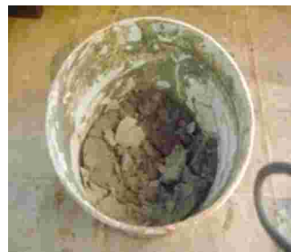
Gambar 4. Tanah liat warna abu-abu dari daerah Makassar, Jenis tanah Regosol Coklat