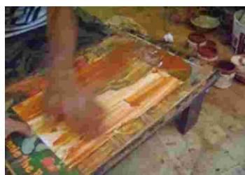
Gambar 23. Tahap pemberian gradasi warna.