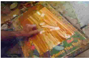
Gambar 25. Proses membentuk objek menggunakan bilah bambu.

Tahap pembuatan objek menggunakan alat bilah bambu