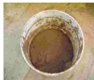
Gambar 6. Tanah liat warna coklat susu dari daerah Gowa, Jenis tanah liat Latosol