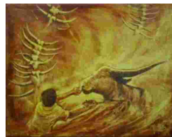
Gambar 31. Zaenal Beta, Pattinggoro Tedong (memotong kerbau), 2005. Tanah liat pada kanvas, 50 x 60 cm Koleksi oleh orang Jerman.