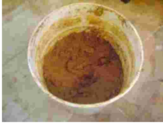
Gambar 7. Tanah liat warna kuning dari daerah Maros, Jenis tanah liat Regosol.