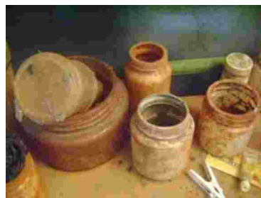
Gambar 17. Wadah tempat menyimpan tanah liat