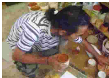
Gambar 20. Tahap awal melukis, persiapan alat dan bahan lukis