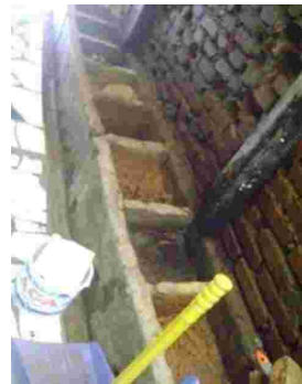
Gambar 11. Wadah tempat pengolahan tanah liat.

organ, kerikil, dan pasir kasar menggunakan saringan (disaring). Selanjutnya, tanah liat direndam dengan air dalam sebuah wadah khusus tempat mengolah tanah liat. Pengolahan tanah liat yang dilakukan Zainal Beta menggunakan cara basah. cara basah dilakukan dengan pencucian tanah dengan banyak air untuk memisahkan kotoran-kotoran yang ada dalam tanah tersebut. Tanah dicampur dengan banyak air, kemudian disaring, dibiarkan mengendap dalam suatu wadah. Jika akan digunakan untuk pembentukan, lempung kering yang telah disaring tersebut kemudian dicampur dengan air secukupnya sehingga diperoleh adonan tanah yang cukup plastis (ASTUTI, 2008: 28-29).