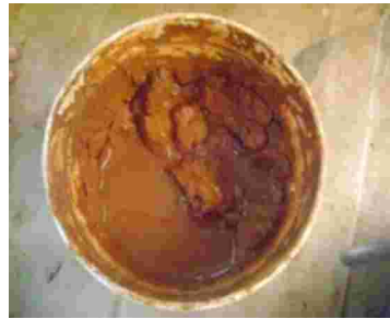
Gambar 3. Tanah liat warna coklat kemerahan dari daerah Sorowako, Jenis tanah Red Yellow Podzoloic.

Terkait hal itu, dalam proses pencarian tanah liat, Zainal Beta memperolehnya dengan menjelajahi berbagai wilayah daerah di Sulawesi Selatan, hingga menemukan kurang lebih 20 tanah liat dengan warna yang berbeda-beda. Adapun tanah liat tersebut diperoleh dari daratan Sulawesi Selatan seperti daerah Maje'ne yang menghasilkan tanah liat warna coklat dengan jenis tanah Latosol, daerah Sorowako menghasilkan tanah liat warna coklat kemerahan dengan jenis tanah Red Yellow Podzoloic, daerah Makassar menghasilkan tanah liat warna abu-abu dengan jenis tanah Regosol Coklat, daerah Malili menghasilkan tanah liat warna merah dengan jenis tanah Latosol, daerah Gowa menghasilkan tanah liat warna coklat susu dengan jenis tanah Latosol, daerah Maros menghasilkan tanah liat warna kuning dengan jenis tanah Regosol, daerah Toraja menghasilkan tanah liat warna ungu dengan jenis tanah Latosol, daerah Gowa menghasilkan tanah liat warna coklat muda dengan jenis tanah Latosol, dan daerah Jeneponto menghasilkan tanah liat warna hitam dengan jenis tanah Grumusol. Tanah liat dari daerah Malili merupakan tanah liat favorit Zainal Beta. Oleh karena, tanah liat tersebut memiliki daya rekat yang kuat serta warna yang cerah (wawancara: ZAINAL BETA, minggu 29 April 2012).