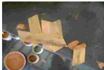
Gambar 19. Alat lukis Zainal Beta yang terbuat dari bilah bambu.