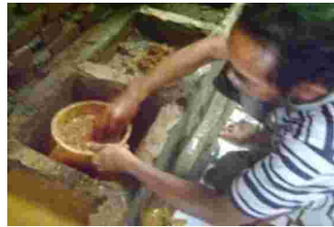
Gambar 15. Proses penyaringan tanah liat dari kotoran.

Pada tahap penyaringan terakhir, tanah liat direndam dengan kapasitas air yang cukup banyak yakni minimal satu ember berukuran medium, bertujuan agar material tanah dan air mencapai keseimbangan. Tanah liat tersebut kemudian diendapkan selama dua hari dan tetap dikontrol agar warna tidak berubah, setelah itu lakukan penyaringan kembali dengan mengikuti kedalaman tanah yakni hanya mengangkat bagian permukaan tanah liatnya. Jika air endapan dalam tanah liat tersebut telah berkurang mencapai 1 cm, kemudian ditempatkan dalam suatu wadah. Tanah liat inilah yang digunakan untuk kebutuhan melukis. Untuk mencapai hasil yang maksimal pengolahan tanah liat tersebut dilakukan secara kontinu hingga menghasilkan tanah liat yang plastis. Sifat plastis dari lempung akan tergantung pada campuran air dalam kadar yang tepat (Raharjo, 1987: 76). Perbandingan tanah liat yang digunakan sebagai bahan pewarna lukisan Zainal Beta adalah 50 % air berbanding 50 % tanah liat.