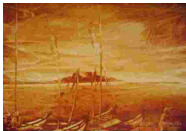
Gambar 28. Zaenal Beta, Pinggir Pantai, 1991 Tanah liat pada kertas, 30 x 40 cm.

berkesenian, dengan semangat hidup dan kegigihan dalam berkarya sehingga mampu mewujudkan keinginannya menjadi seorang seniman/pelukis tanah liat di Makassar. Terkait hal itu, perubahan tema dalam karya lukisan Zainal Beta terjadi pada dekade 2000-an yang menampilkan objek bertemakan budaya lokal. Oleh karena, pada periode ini objek-objek lukisan Zainal Beta yang bertemakan budaya lokal lebih banyak diminati oleh penikmat seni sebagai karya pesanan dan sebagai koleksi. Merujuk pada karya lukisan Zainal Beta cenderung menggunakan gaya ekspresif. Hal ini ditandai melalui proses penciptaan karya lukisannya dengan kebebasan ekspresi melukis di luar studio dan langsung berhadapan dengan objek. Selain itu, dapat dicermati pula pada goresan dalam karya lukisannya yang memberikan kesan menggelora. Dalam melukis secara ekspresif pada umumnya dikaitkan dengan cara menggores atau sifat goresan yang terkesan kuat dan emosional (SUSANTO, 2011: 116). Adapun visualisasi karya-karya lukisan Zainal Beta bertemakan kehidupan sosial dan budaya lokal adalah sebagai berikut.