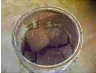
Gambar 8. Tanah liat warna ungu dari daerah Toraja, Jenis tanah liat Latosol Sumber: Dokumentasi Pribadi, 2012.