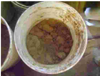
Gambar 9. Tanah liat warna coklat muda dari daerah Gowa. Jenis tanah liat Latosol.