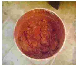
Gambar 5. Tanah liat warna merah dari daerah Malili, Jenis tanah liat Latosol.