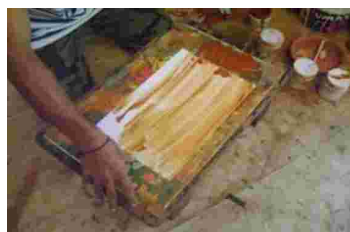
Gambar 22. Tahap memoles permukaan kertas dengan tanah liat.