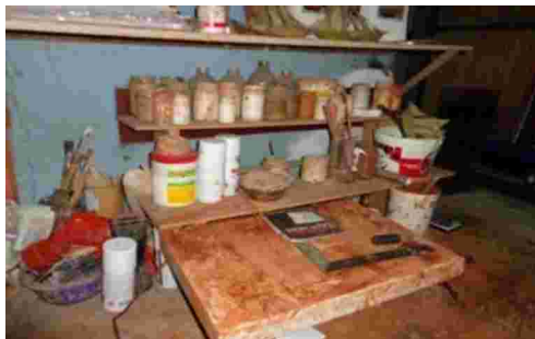
Gambar 18. Media tanah liat dan alat lukis Zainal Beta