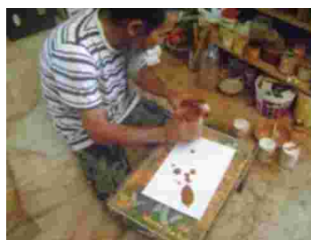
Gambar 21. Tahap menuangkan tanah liat pada kertas.