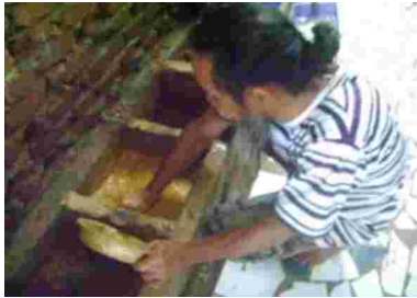
Gambar 13. Proses pengolahan tanah liat yang dihancurkan dengan gerakan tangan.

awal penyaringan tanah liat yang kemudian diendapkan 2 hingga 3 hari, lalu disaring kembali dengan mengikuti kedalaman tanah yang disaring.