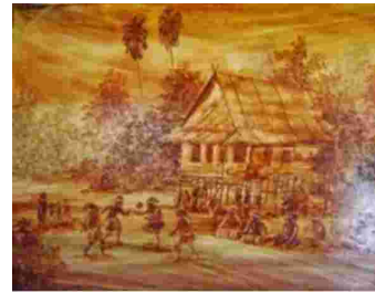
Gambar 30. Zaenal Beta, Pa'raga, 2012. Tanah liat pada kanvas, 70 x 100 cm. Koleksi hotel Singgasana