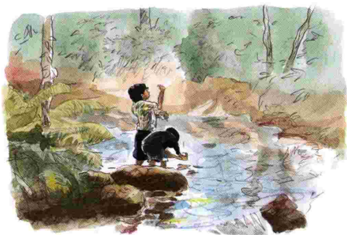
Gambar 1. permainan tatawuan di sungai di Baduy Dalam.

Bagi anak-anak usia 7-12 tahun merupakan masa di mana anak mengeksplorasi wilayahnya, namun pendidikan yang diberikan orang tuanya, di mulai dengan tata tertib, cinta pada sesama hidup, dan pendidikan agama diberikan dengan cara menyaksikan keindahan alam sekitarnya. Seperti pada permainan tatawuan memindahkan air dengan tangan yang pada akhirnya mendapatkan ikan untuk di konsumsi, namun dibalik itu adalah pengajaran bentuk pada upacara kawalu yang membutuhkan ikan dengan cara ditangkap tangan. Tawu dalam bahasa sunda bentuk pekerjaan memindahkan dengan cara diambil memakai tangan. Tatawuan di lakukan oleh anak-anak di sungai yang ada di sekitar kampung di daerah Baduy Dalam. Mereka membendung setengah badan sungai jadi dua, aliran air sungai akan beralih pada sisi yang tak di bendung, kemudian di bagian hilir yang di bendung sisa air di tawu dengan menggunakan tangan, dengan tujuan airnya hilang maka bisa mengambil ikan dan binatang air lainnya. Saat melakukan kegiatan menyurutkan air dengan cara di tawu itulah anak-anak bermain dengan cara saling menyemburkan air nya, sampai air nya surut. Air yang berisi menjadi kosong dan yang kosong menjadi isi, dengan ikan-ikannya.