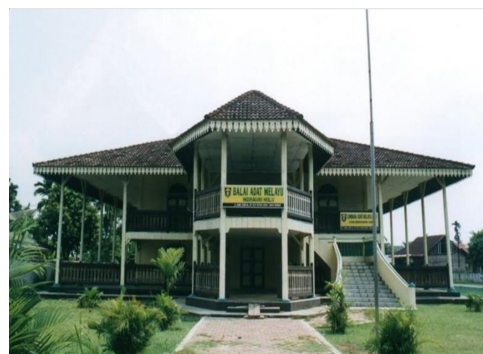
Gambar 3: Rumah Menteri sebagai Balai Adat Melayu

Rumah Menteri Kerajaan Indragiri sempat mengalami beberapa kali perubahan fungsi, yang disebabkan oleh beberapa faktor. Mulai dari beralih fungsi sebagai tempat pemukiman atau tempat tinggal para keturunannya, bahkan pada tahun 60-an sampai 80-an sempat digunakan juga sebagai tempat tinggal anak – anak sekolahan dari daerah lain yang datang ke Rengat untuk belajar, serta beberapa guru dari daerah lain yang mengajar di Rengat tetapi belum memiliki rumah tempat tinggal, maka mereka tinggal di Rumah Menteri tersebut. Rumah ini juga pernah difungsikan sebagai Balai Adat Melayu Indragiri Hulu karena bentuk rumahnya yang mewakili seperti rumah adat melayu. Juga pernah sempat difungsikan beberapa tahun sebagai Politeknik Indragiri Hulu, dan juga dimanfaatkan menjadi pusat kerajinan bertenun dibawah pengawasan perindustrian daerah Kabupaten Indragiri Hulu.