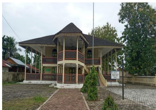
Gambar 2: Rumah Menteri Kerajaan Indragiri

Dan pada tahun 1885 M, Engku Togok membangun sebuah rumah yang cukup besar dan megah, rumah tersebut terkenal dengan nama Rumah Menteri atau biasa masyarakat sekitar menyebutnya dengan nama Rumah Tinggi. Rumah Menteri tersebut dibangun dari penghasilan upeti serta pemungutan pajak terbesar untuk kerajaan Indragiri dari sektor 5aritime. Rumah tersebut didirikan dengan mendatangkan tukang-tukng pekerja dari Singapura, menggunakan arsitektur khas melayu, terdiri dari dua lantai, dengan lantai dasar sebagai dapur dan lantai atas sebagai tempat peristirahatan, hal itu pulalah yang menjadikan bangunan ini sebagai bangunan paling tinggi didaerah tersebut pada masanya. Rumah ini didirikan dengan menggunakan bahan yang terbuat dari kayu kapur dengan atap terbuat dari sirap dan bentuk tangga yang melingkar. Tujuan didirikannya rumah tersebut yakni untuk tempat tinggal menteri bersama keluarga beserta keturunannya.