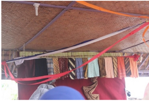
Gambar 6. Bale-bale tempat pelaksanaan upacara adat. Sumber: Dokumentasi Penelitian, 2014-2024.

Bale-bale sebagai tempat upacara adat dilengkapi dengan sesajen dan Tarawangsa. Bentuk arena pertunjukan dengan melingkar dengan posisi penari di tengah lingkaran. Upacara Ngalaksa dimulai dari proses Nginebkeun Dewi Sri .