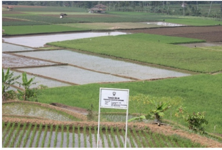
Gambar 1. Petunjuk Lokasi Wisata Budaya dan Hampanan Sawah di Desa Rancakalong, Sumedang.

Wilayah Desa Wisata Rancakalong berada di dataran tinggi. Masyarakat Rancakalong sebagai masyarakat agraris memiliki mata pencaharian sebagai petani. Mereka menganggap upacara adat atau ritual ngalaksa merupakan bagian terpenting sebagai petani dan upaya menghormati Dewi Padi. Praktik ritual ngalaksa sebagai tradisi dan kesadaran agraris dikomunikasikan dalam bentuk simbol seni pertunjukan dan upacara adat.