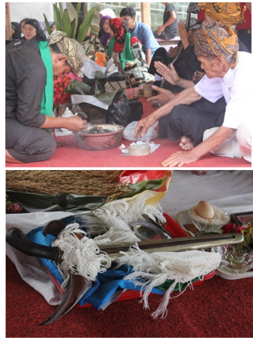
Gambar 5. Saehu melakukan ritual membakar menyan putih, mengucapkan mantra dan sebilah keris.

Setelah melakukan upacara adat, para pelaku arak-arakan ini menuju tempat yang telah disediakan untuk menyimpan peralatan dan makanan. Berikut gambar selendang/sampur , keris, dan sesaji lainnya: