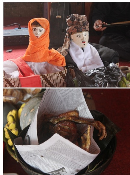
Gambar 3. Sesajen dan Boneka yang terbuat dari Pare.

Ritual ngalaksa dan seni Tarawangsa merupakan salah satu upaya masyarakat Rancakalong untuk menghidupkan padi dan harmonisasi antara Tuhan-Alam-Manusia. Upaya ini dilakukan oleh masyarakat Rancakalong untuk mendapat berkah sebagai petani. Berikut berbagai simbol dan sesajen dalam upacara adat ngalaksa :