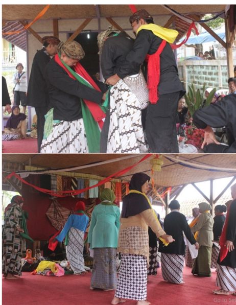
Gambar 7. Para penari laki-laki dan penari perempuan.

Sesajen berupa sepasang pare yang dibentuk menjadi kepala laki-laki dan perempuan, hasil olahan makanan, bunga dan buah-buahan. Bentuk boneka ini sebagai simbol Pangramaan-Paibuan . Orang yang menari dengan iringan Tarawangsa biasanya mengalami trance atau kesurupan. Penari yang trance dianggap sebagai wujud nyata dari kehadiran Karuhun . Pesan dari Karuhun tersampaikan melalui orang atau penari yang trance . Berikut para penari laki-laki dan penari perempuan sedang menari diiringi Tarawangsa: