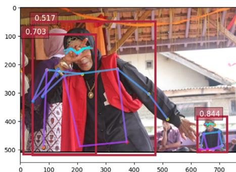
Gambar 8. Deteksi Pose Gerak Trance dengan GluonCv

Gerak tari tersebut terkadang bebas sesuai dengan keinginan penari atau improvisasi. Kadang ada penari yang trance mendekati arah tamu undangan atau penari lainnya. Ketika penari mengalami trance dapat dibedakan dengan penari biasa. Untuk mengenali pose gerak penari yang trance dilakukan deteksi dengan menggunakan estimasi pose gerak dengan GluonCV. Berikut hasil eksperimen deteksi pose gerak penari yang mengalami trance dengan penari yang tidak mengalami trance .