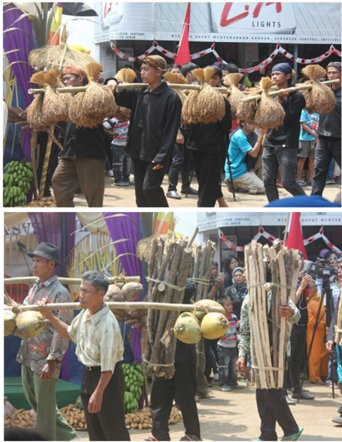
Gambar 4. Arak-arakan hasil panen pare dari 5 ruruan.