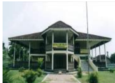
Gambar 3: Rumah Menteri sebagai Balai Adat Melayu Sumber: http://direktoripariwisata.id/unit/7528 , Diunduh pada tanggal, 17 September 2021.

Rumah Menteri Kerajaan Indragiri sempat mengalami beberapa kali perubahan fungsi, yang disebabkan oleh beberapa faktor. Mulai dari beralih fungsi sebagai tempat pemukiman atau tempat tinggal para keturunannya, bahkan pada tahun 60-an sampai 80-an sempat digunakan juga sebagai tempat tinggal anak – anak sekolahan dari daerah lain yang datang ke Rengat untuk belajar, serta beberapa guru dari daerah lain yang mengajar di Rengat tetapi belum memiliki rumah tempat tinggal, maka mereka tinggal di Rumah Menteri tersebut. Rumah ini juga pernah difungsikan sebagai Balai Adat Melayu Indragiri Hulu karena bentuk rumahnya yang mewakili seperti rumah adat melayu. Juga pernah sempat difungsikan beberapa tahun sebagai Politeknik Indragiri Hulu, dan juga dimanfaatkan menjadi pusat kerajinan bertenun dibawah pengawasan perindustrian daerah Kabupaten Indragiri Hulu.