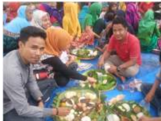
Gambar 2. Warga desa dengan para tamu melakukan Manggan Rame di area pintu gerbang utama desa yang menyajikan menu khas Sumbawa.

kan lagi diadakan sebagai kegiatan tolak bala, melainkan sebagai perwujudan rasa syukur masyarakat Desa Pernek kepada Allah. Hal ini dikarenakan wabah yang pernah terjadi sudah tidak ada lagi dan masyarakat patut untuk bersyukur atas hal itu. Namun, ritual ini tetap diadakan di sekitar waktu musim kemarau berkepanjangan atau peralihan antara musim kemarau dengan musim hujan (antara September hingga Desember).