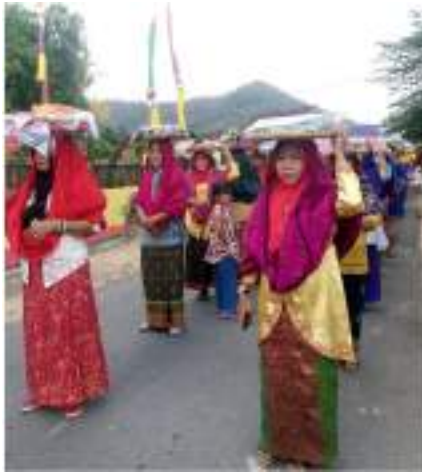
Gambar 1. Pawai Liuk Desa. Para wanita menggunakan kere dua sembari membawa 1 tepi/tampah yang berisi panganan khas Sumbawa.

Modifikasi juga terlihat pada tampilan sajian makanan dan tepi (tampah) yang digunakan lebih bervariasi dengan hiasan yang lebih semarak. Menu makanan yang dihidangkan juga lebih beragam, seperti sepat dan singang yang terbuat dari ikan, serta pelu aru sebagai lauk-pauknya.