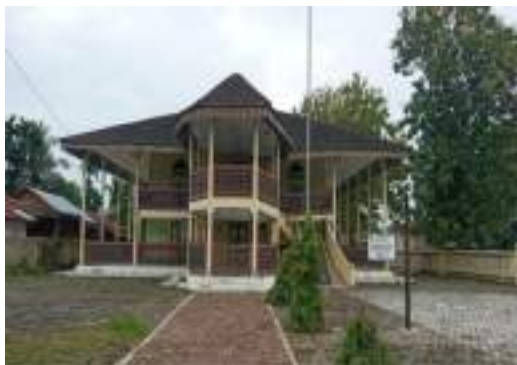
Gambar 2: Rumah Menteri Kerajaan Indragiri

Dan pada tahun 1885 M, Engku Togok membangun sebuah rumah yang cukup besar dan megah, rumah tersebut terkenal dengan nama Rumah Menteri atau biasa masyarakat sekitar menyebutnya dengan nama Rumah Tinggi. Rumah Menteri tersebut dibangun dari penghasilan upeti serta pemungutan pajak terbesar untuk kerajaan Indragiri dari sektor 5aritime. Rumah tersebut didirikan dengan mendatangkan tukang-tukng pekerja dari Singapura, menggunakan arsitektur khas melayu, terdiri dari dua lantai, dengan lantai dasar sebagai dapur dan lantai atas sebagai tempat peristirahatan, hal itu pulalah yang menjadikan bangunan ini sebagai bangunan paling tinggi didaerah tersebut pada masanya. Rumah ini didirikan dengan menggunakan bahan yang terbuat dari kayu kapur dengan atap terbuat dari sirap dan bentuk tangga yang melingkar. Tujuan didirikannya rumah tersebut yakni untuk tempat tinggal menteri bersama keluarga beserta keturunannya.