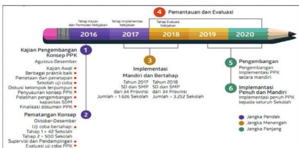
Gambar 1. Implementasi PPK

Karakter mandiri yaitu sikap atau perilaku seseorang yang tidak bergantung pada orang lain. Karakter mandiri ini dapat dilakukan dengan menerapkan pembiasaan kepada peserta didik untuk melakukan sesuatu tanpa bantuan orang lain. Karakter mandiri ini dapat diterapkan kepada anak sejak usia dini sehingga ketika anak tersebut tumbuh dewasa, karakter mandiri sudah terbentuk dalam dirinya. Pendidikan karakter mandiri adalah Pendidikan yang membentuk akhlak, watak, budi pekerti dan mental manusia agar