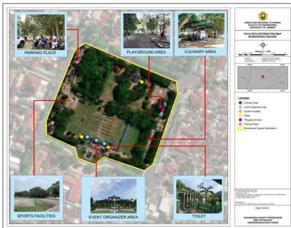
Gambar 1. Peta Sebaran Fasilitas

Ruang terbuka publik yang berkualitas dapat dilihat dari 3 variabel yaitu kebutuhan, hak, dan bermakna [9]. Berdasarkan pernyataan tersebut, berikut merupakan kondisi eksisting Alun-alun Bondowoso sebagai ruang terbuka publik dengan menggunakan 16 indikator menurut Carr dapat dilihat pada tabel 3.