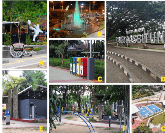
Gambar 4. Preseden A) Tempat Duduk, B) Lampu Penerangan, C) Tempat Sampah, D) Pedestrian, E) Toilet Umum, F) Fasilitas Bermain, G) Fasilitas Olahraga