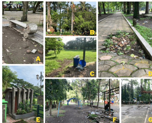
Gambar 2. Kondisi Eksisting A) Tempat Duduk, B) Lampu Penerangan, C) Tempat Sampah, D) Pedestrian, E) Toilet Umum, F) Fasilitas Bermain, G) Fasilitas Olahraga